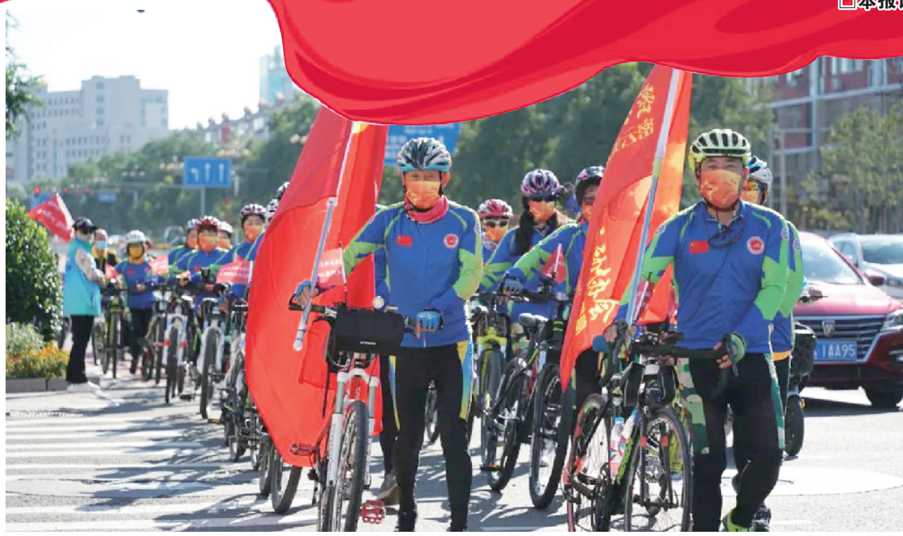
助力创城骑行宣传活动举行

大力弘扬劳模精神、劳动精神、工匠精神,进一步激励全区广大劳动者爱岗敬业、拼搏奉献,密云区总工会立足职能作用,结合创城工作,积极开展各种形式的“劳动创造幸福”主题宣传活动,助力全国文明城市建设,让“文明之花”深入人心。