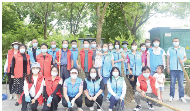
职工志愿者开展“周末大扫除”活动