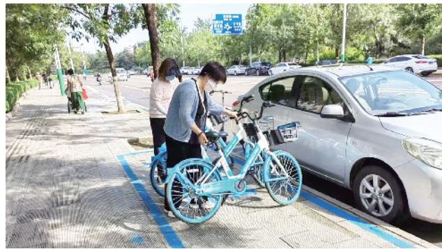
工会干部走上街头参与志愿服务