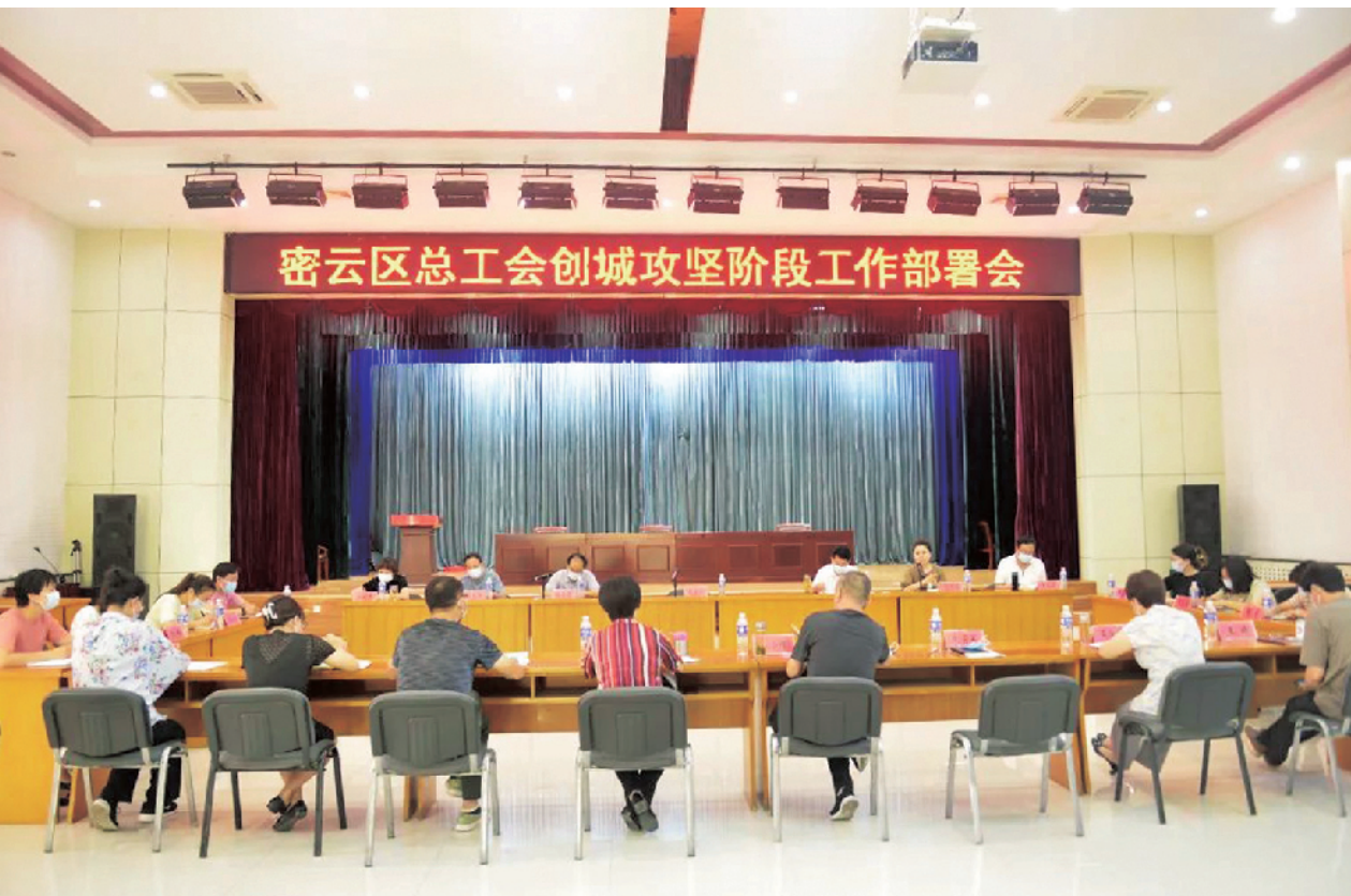
密云区总工会举行创城攻坚阶段工作部署会