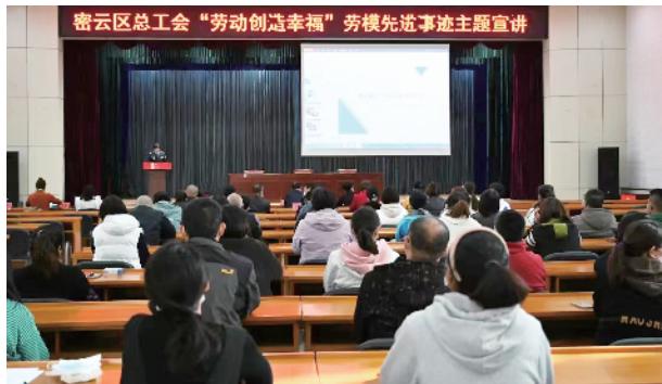
“劳动创造幸福”劳模先进事迹主题宣讲活动举行

为践行“两山”理论,推动“两区”建设,努力实现“四个确保”和“五个样板”的目标,密云区总工会全体党员干部签署履行保水护水责任承诺书,自觉签订《创建全国文明城市党员承诺书》,主动回社区(村)报到,认领志愿服务岗位,参与周末大扫除、垃圾分类、专项整治等活动。积极开展“光盘行动”和“反对浪费、崇尚节约”等文明行动,形成制止餐饮浪费长效机制。密云区总工会全体机关干部还落实开展“我为创城做一件实事”活动,积极开展办公环境清洁工作。如今,密云区工会干部早已成为创城工作的“先锋队”,活跃在密云的大街小巷。