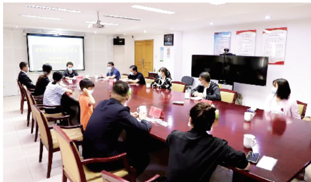
“讲劳模故事 传文明家风”文明家庭创建活动开展