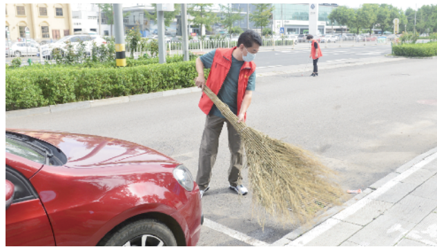
工会干部带头参与创城志愿服务

创城有我,工会在行动。密云区总工会深入贯彻落实密云区委关于创建全国文明城市的相关工作部署,充分发挥职能作用,组织动员全区各级工会组织及广大干部职工积极参与到助力创城工作中来,为密云区创建全国文明城市建设注入“工”力量。