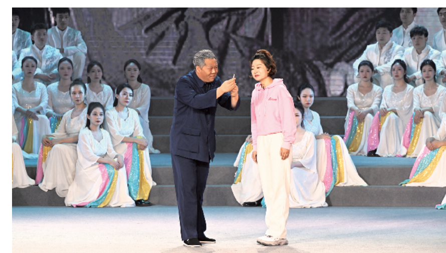
情景表演《留香人间》