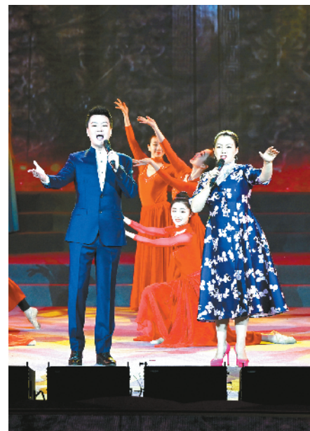
重唱 舞蹈《大国工匠》