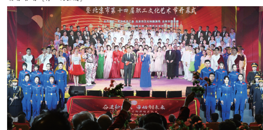
北京广播电视台主持人聂一菁 阿龙