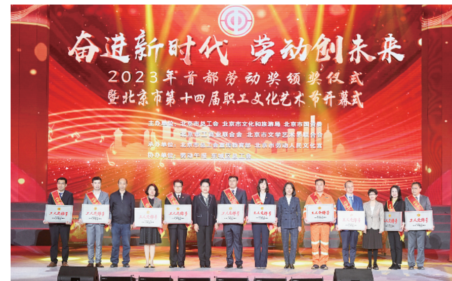
北京市总工会党组成员、副主席王敬东,北京市总工会党组成员、副主席赵丽君,北京市文化旅游局二级巡视员杨连霞,北京市东城区总工会主席吕德成为获得2023年北京市工人先锋号的集体代表颁发奖牌