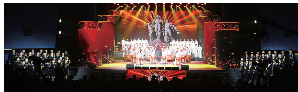
鼓舞 合唱《咱们工人有力量》