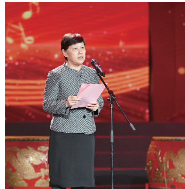
北京市人大常委会党组副书记、副主任，北京市总工会主席齐静致辞