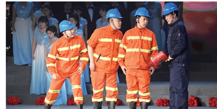
情景表演《生命火花》