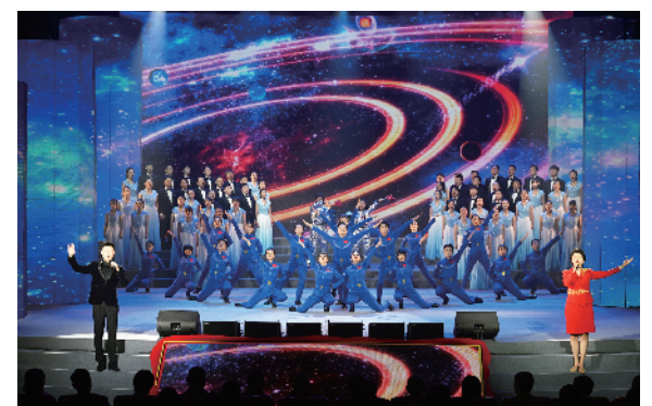
领唱 合唱 舞蹈《中国神舟》