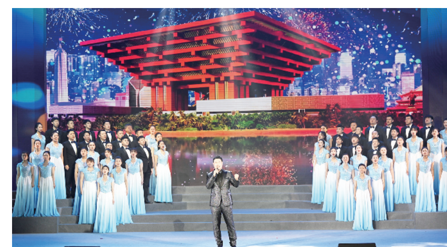
领唱 合唱《再一次出发》