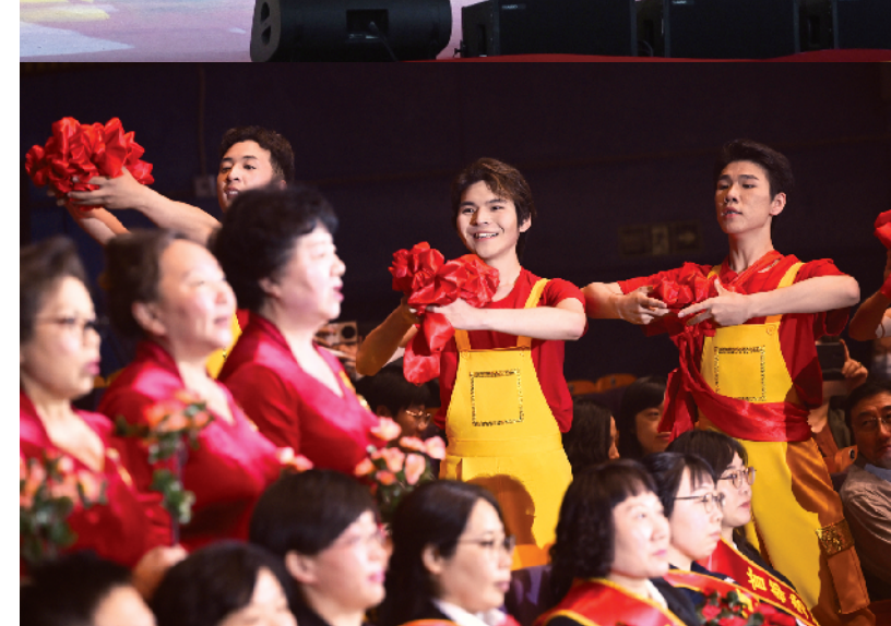
台上演员和台下首都劳模合唱团的劳模们互动演出节目《好样的》