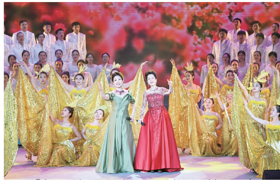
领唱 合唱 舞蹈《春天与时代》