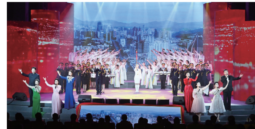
联唱《流金的岁月难忘的歌》