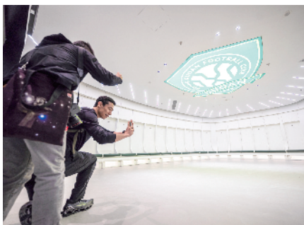
主队更衣室令人眼前一亮

记者从北京市重大项目办获悉，工人体育场改造复建工程（简称“新工体”）已于近日完成竣工验收工作。我们熟悉的那座“工体”，现在什么样了？3月31日，记者来到“新工体”进行实地探访。