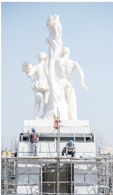
在北广场正中央，“工人迎宾”雕塑格外引人注目