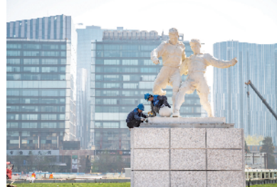
工人对体育场旁的雕塑进行收尾工作