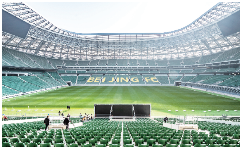
“新工体”看台采用了当今最先进的“看台碗”结构

据了解，改造后的“新工体”主要地上建筑只有足球场，其他地方将建设为占地面积约10万平方米的城市体育公园和3万平方米的湖区，为市民和球迷打造多功能健身设施与休憩小景，公园内将建设环保健身跑道等多种体育场地及设施，成为一个以球场为核心的开放型城市体育公园，再现1959年建成初期工体疏朗开阔、庄重大气的空间格局。同时也为市民提供便捷舒适的大众健身环境，进一步增强市民的“幸福感”“获得感”。