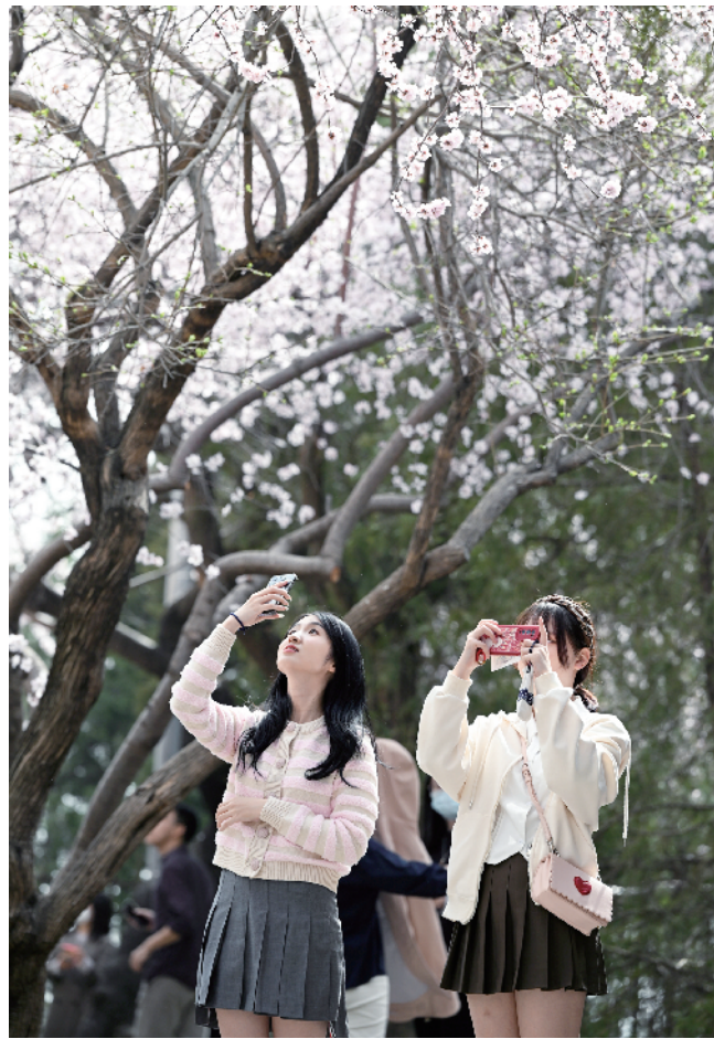
各大公园桃红柳绿，年轻人陶醉在美景中

不负光阴不负春，身处早春的北京，不要辜负这人间最美的时光，一起走出宅居，一起来邂逅这京城最美的春天吧。