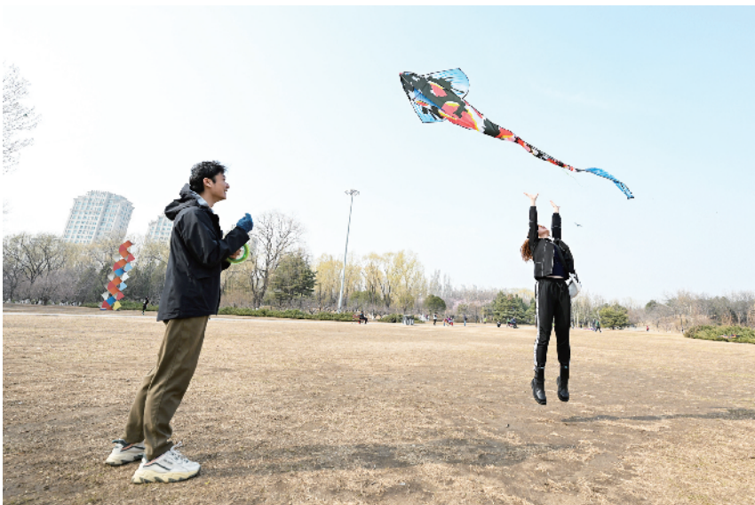
市民在朝阳公园享受春天里放风筝的乐趣