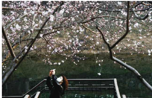
安定门西滨河路盛开的桃花吸引市民拍照留念