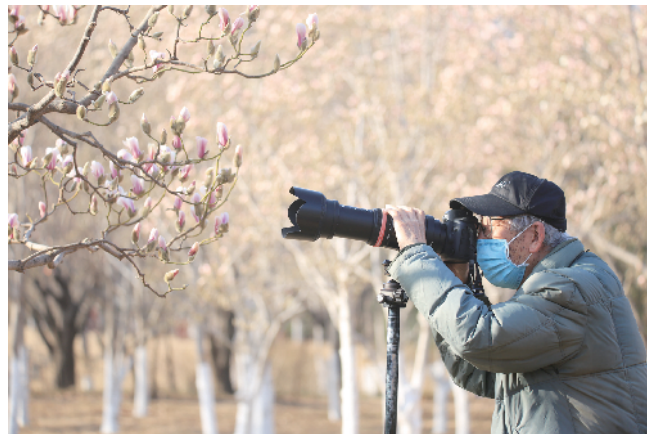
雕塑公园内盛开的玉兰花成为摄影爱好者眼中的“春”