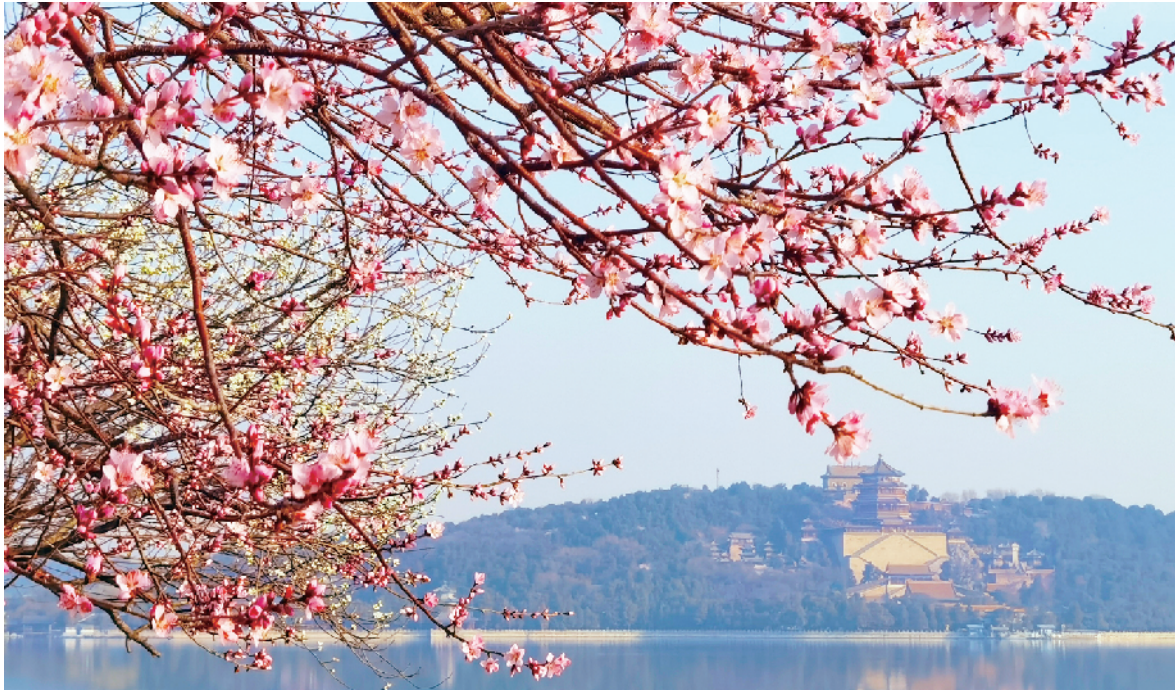
颐和园西堤山桃花盛开