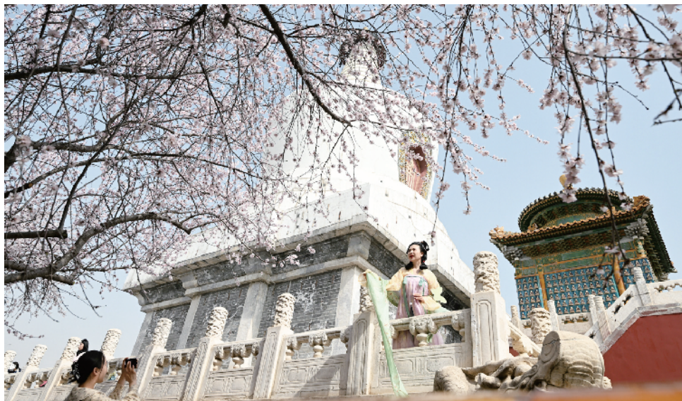
北海公园山桃映白塔