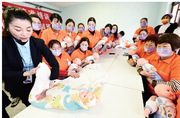
培训师现场演示给宝宝打包被