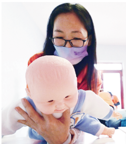
学员利用课间休息时间练习“飞机抱”

“阿姨给你揉揉臂，宝宝长大力气；阿姨给你揉揉腿，宝宝会跳还能跑；阿姨给你揉揉背，宝宝干啥都不累。”学员们一边背诵着讲师编写的按摩顺口溜儿，一边用婴儿模型进行按摩训练。在近日由延庆区人社局、诗安国际母婴会所联合举办的鹤桥培训直通车之母婴护理行业专项带岗培训班上，一堂理论结合实操的课程有条不紊地进行着。讲师一边讲解，一边示范标准动作，学员们聚精会神，领会吸收母婴护理工作的要点。