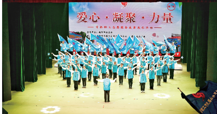
首都职工志愿服务“爱心·凝聚·力量”成果展示活动

市总工会有关部门负责人、东城区产业工人队伍建设改革协调小组成员单位代表、企事业单位代表等参加此次活动。