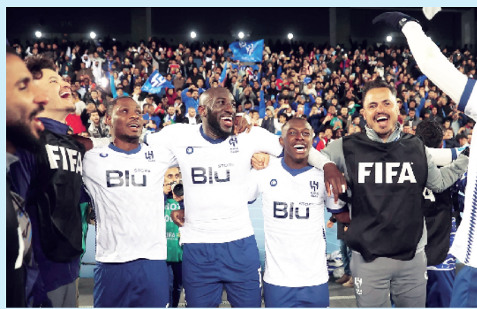
利雅得新月球员庆祝胜利

这不是亚洲球队第一次闯进世俱杯决赛，以前日本球队已经完成过这一壮举。中国足球在男子成年层面，唯一的大赛奖牌也来自世俱杯，广州恒大曾经夺得过世俱杯的季军。亚洲球队还难以给欧洲球队构成太大的威胁，但是在面对其他大洲的俱乐部冠军时，亚洲顶尖俱乐部球队并不吃亏。利雅得新月延续了亚洲球队的这一态势，接连击败东道主卡萨布兰卡和南美冠军弗拉门戈，证明了利雅得新月的实力。这家沙特俱乐部是近年来在亚冠表现最出色的球队之一——