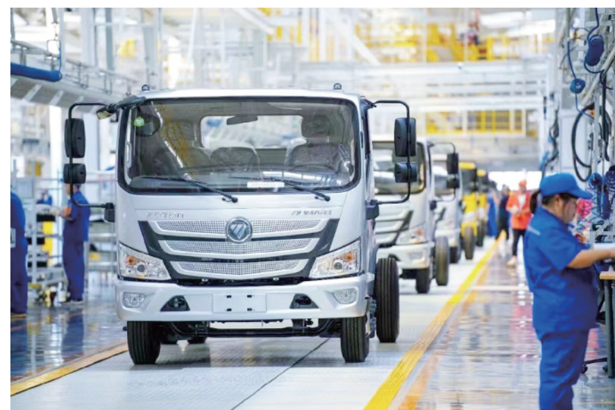
北汽集团汽车生产线冲刺“开门红”