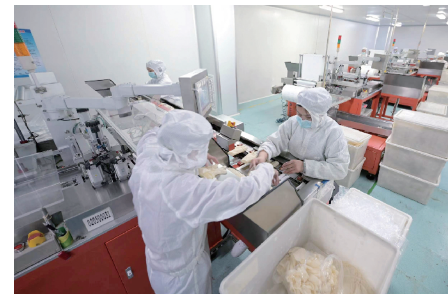
化工集团手套生产线上工人正在检测产品