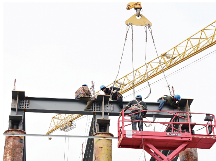
中关村论坛永久会址主会场项目工地上，工人们正在进行施工作业