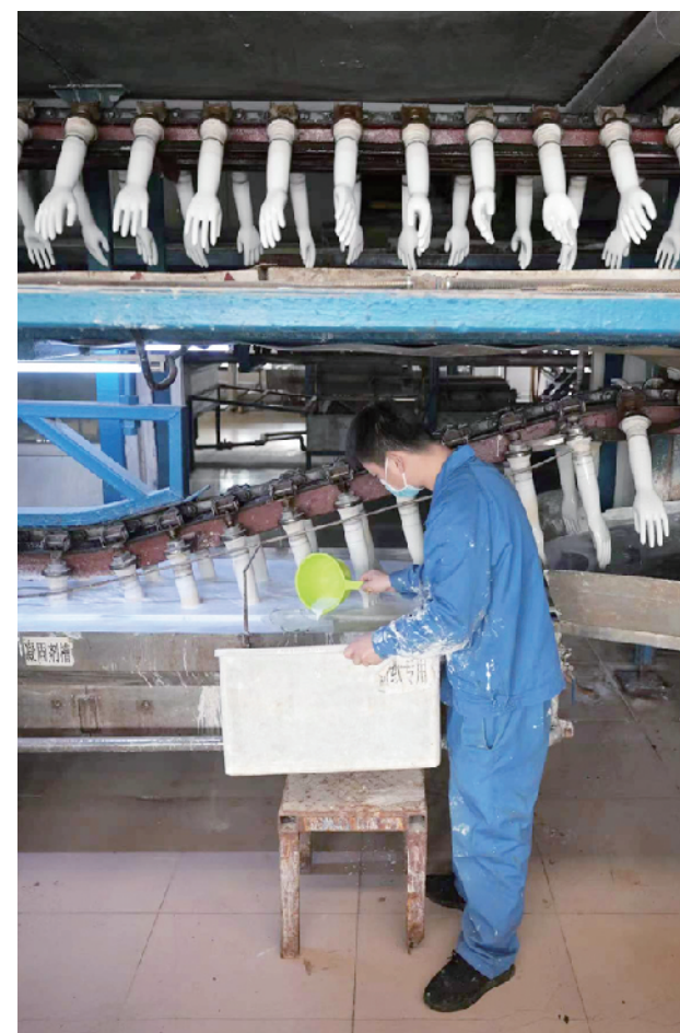
北京瑞京乳胶制品公司车间内忙碌的生产场面