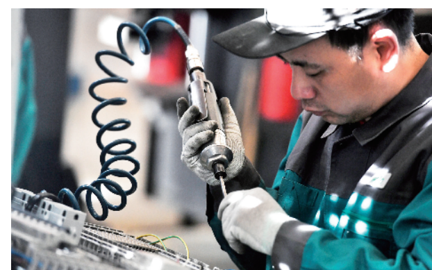
威乐(中国)水泵系统有限公司控制柜组装区职工安装接线