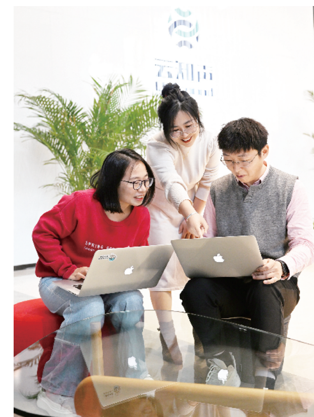
AI科技企业云知声公司工作人员在交流技术问题