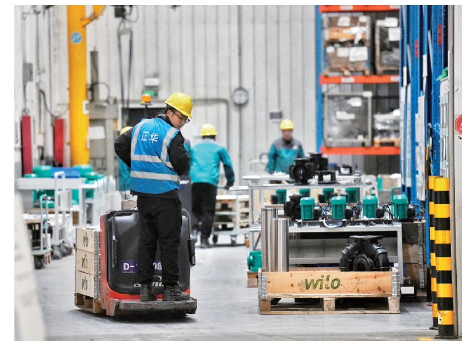
威乐(中国)北京工厂内，进出库房的车辆你来我往