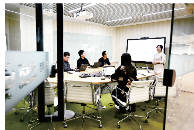
云知声公司工作人员召开业务探讨会