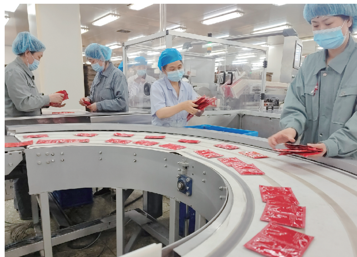
同仁堂科技公司药品流水线开足马力，工人们正在进行分拣作业

在北汽集团，各条生产线亦火力全开，他们以“起步即冲刺”的精气神，在生产、销售、服务、海外市场等各个领域打响了开工战役，一个个重大项目正全力推进，呈现出热火朝天的场面。职工们纷纷表示，开工就开跑，要动如脱兔，奋力夺取“开门红”，为首都经济高质量发展贡献力量。