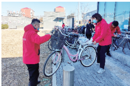
职工志愿者清理码放路边自行车