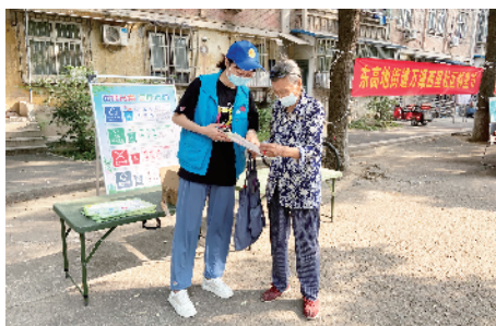
职工志愿者宣传垃圾分类