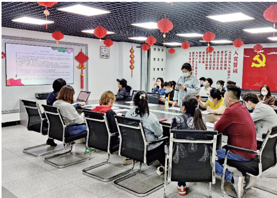
▲职工志愿者读书分享会

信息宣传组的职工志愿者们小区内进行各种政策信息、防控知识的宣传;号召居民减少出行、不参加聚集活动、有条件的尽快接种疫苗;演示正确洗手的步骤、正确规范佩戴口罩的方法,提高居民的防疫意识。