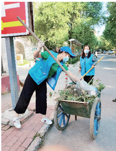
职工志愿者清理卫生死角