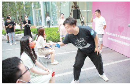
丰台区妇联、丽泽管委会机关工会组织开展七夕联谊活动

除此之外,丽泽管委会机关工会组织机关及入驻企业职工开展城市森林义务绿化主题活动,在已基本建成并对外开放的丽泽商务区滨水文化公园(一期)