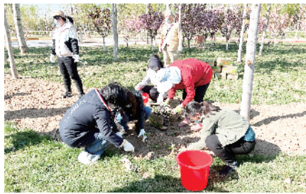
丽泽管委会机关工会组织入驻企业职工开展城市森林义务绿化主题活动

“今年新冠肺炎疫情反复,疫情防控形势严峻,印象深刻的就是每次我从核酸采样点下来,都能感受到来自工会组织的关怀,冬天是暖宝宝,夏天是防暑降温冰块……”连续支援大规模核酸检测的工作人员说。数次疫情防控支援期间,丽泽管委会机关工会全体职工积极投身疫情防控