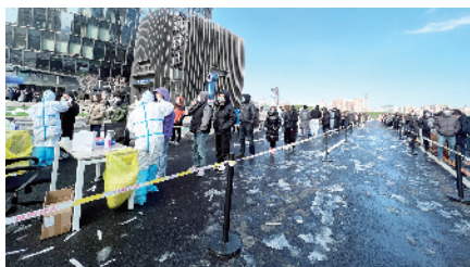
为商务区入驻企业免费进行全员核酸检测