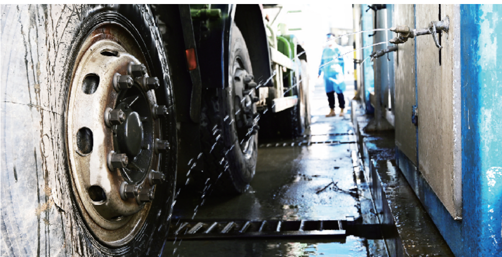
车辆出厂前轮胎都要冲洗干净