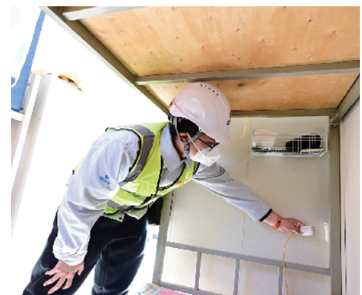
宿舍电器要人走电断