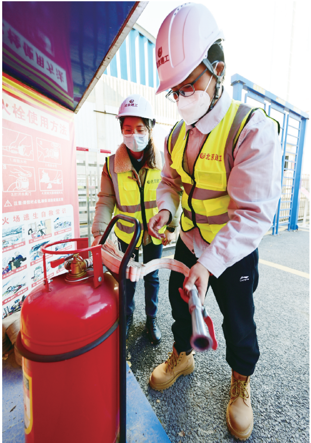
定期巡检灭火器的外观和气压