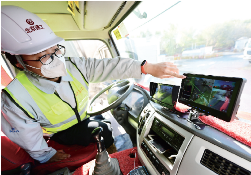
检查车辆倒车影像