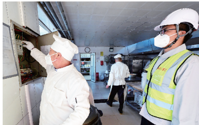
巡查厨房用电安全