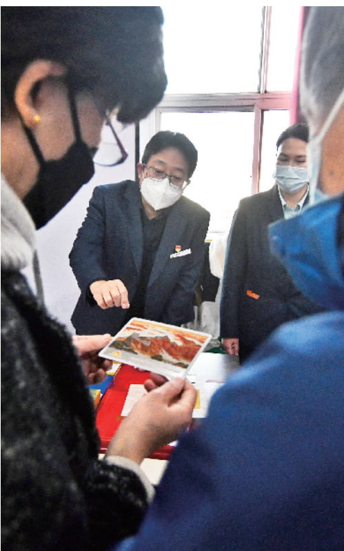
观众挑选心仪的邮品

“这张小型张是党的二十大的纪念邮票之一。该邮票以人民大会堂为背景，呈现了全国各族人民团结在一起共襄盛举。今天，我们就通过邮票背后的故事来深入学习党的二十大报告……”11月15日，位于丰台区的航天一院211厂内，一场别开生面的党的二十大精神专题学习会举行。