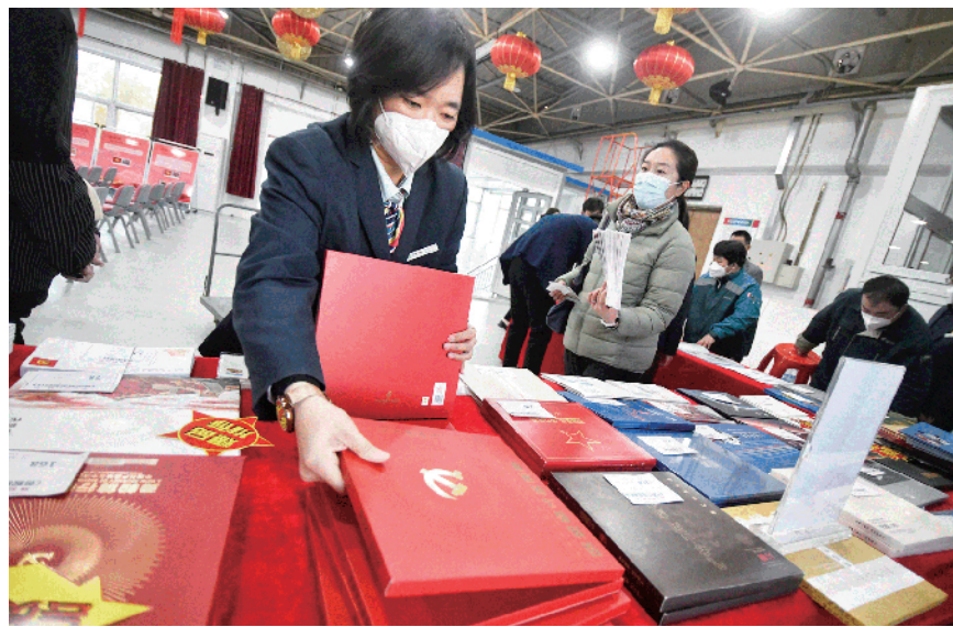
邮政职工在布置党的二十大纪念邮品展示台

活动现场陈列有20块红色展板，展示了由中国邮政发行的历次党的代表大会纪念邮票。在邮票品鉴展台上，陈列着各个门类的红色纪念邮票，包括庆祝