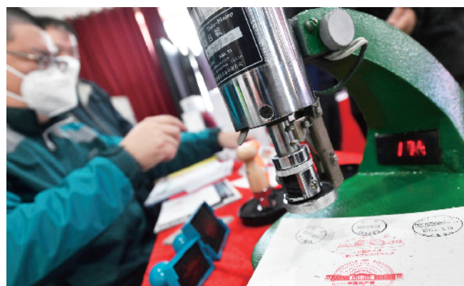
邮政职工为邮品加盖党的二十大纪念戳