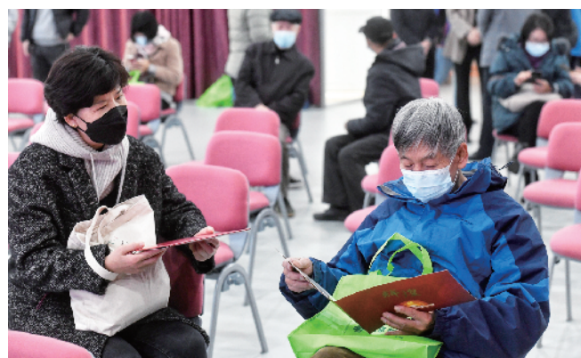
观众交流新购邮品

据悉，为丰富党的二十大精神学习宣传形式，发掘邮政品牌中的红色资源，丰台邮政主动联系辖区内的街道社区、企事业单位与学校、军营，开展了“赏邮票 学报告 话成就”系列主题活动。截至目前，活动已举办近50场。