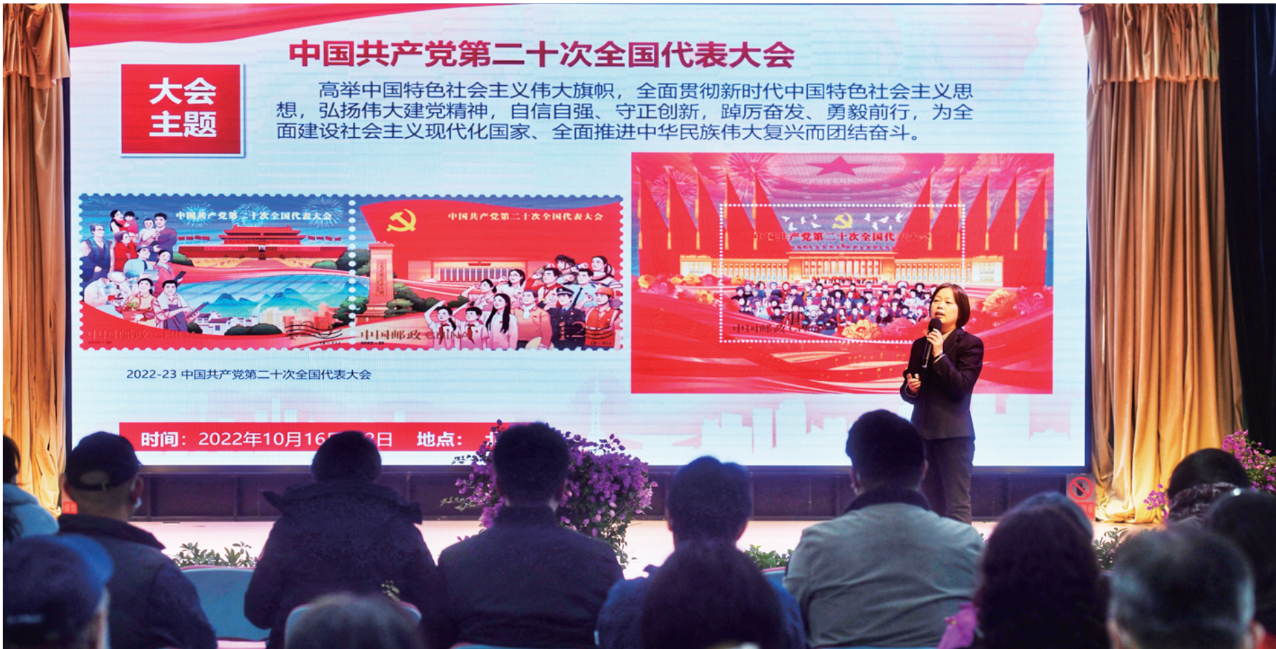
北京邮政教育培训中心的老师结合邮品宣讲党的二十大精神