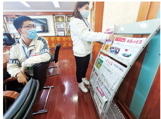
组委会专门为参赛选手准备了报刊读物