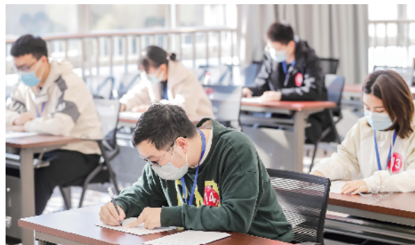
选手要通过笔试、答辩、实操等环节