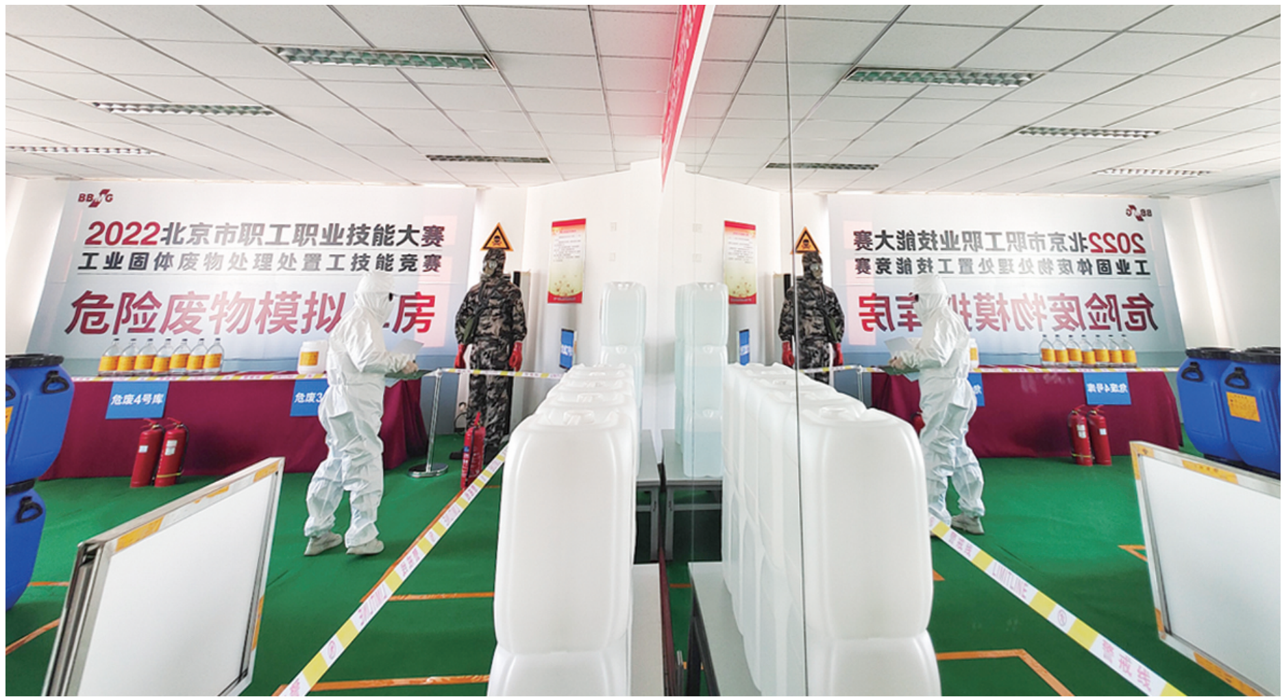
还原真实场景进行实操能力考核