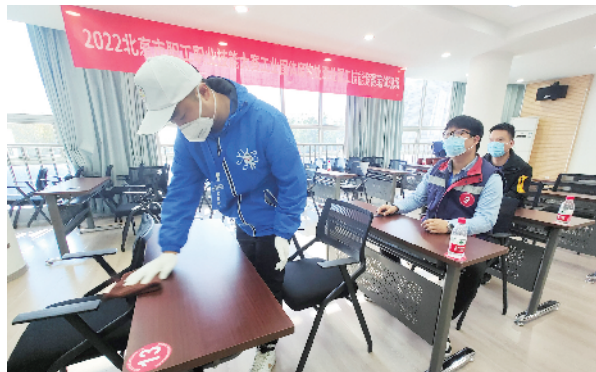
比赛志愿者严格落实防疫要求,认真对考场进行消毒