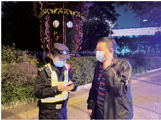
▲党的二十大期间进行街头巡查