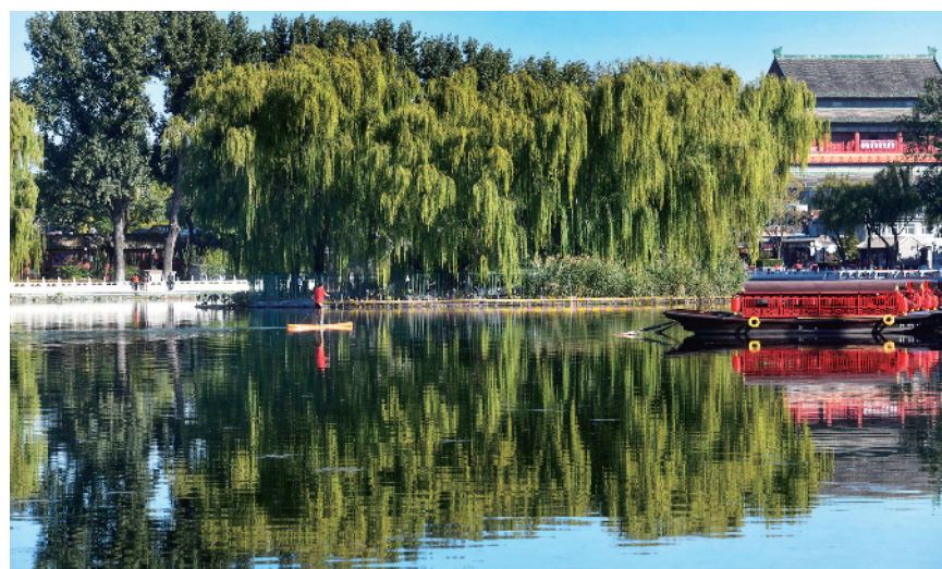
秋天的什刹海“倒影入清漪”