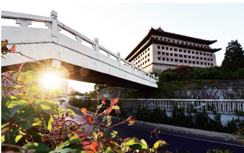
阳光下的崇文门角楼油画般秀美