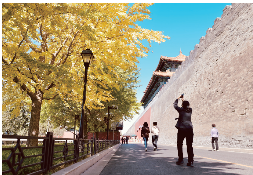
高大雄伟的古城墙与银杏叶交相辉映