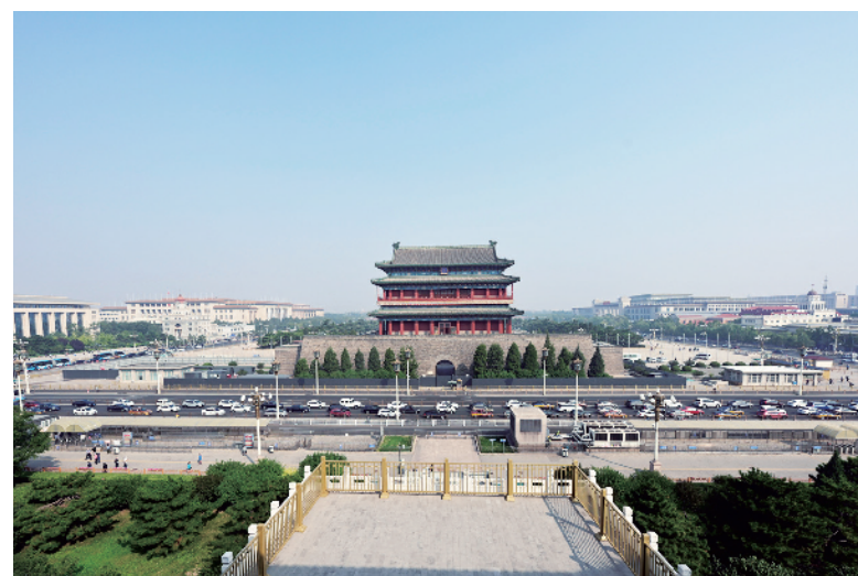
中轴线上的正阳门焕发新彩