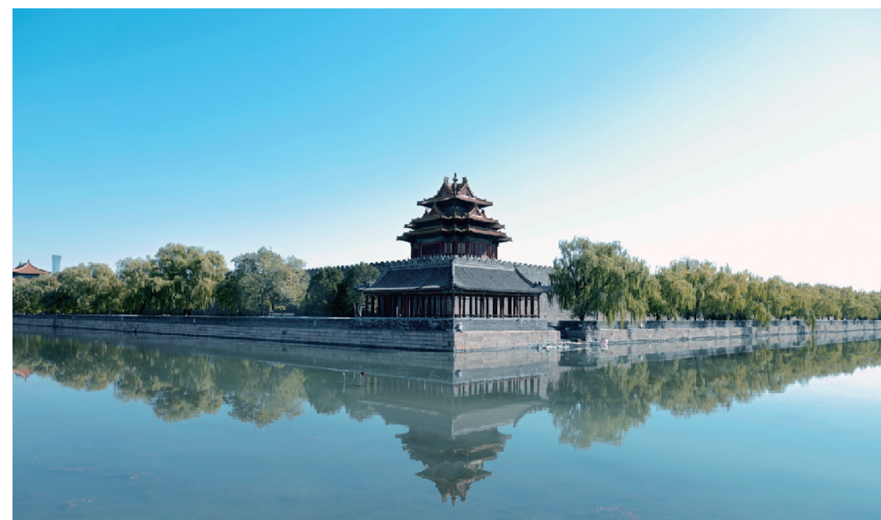
蓝天下宁静的故宫角楼