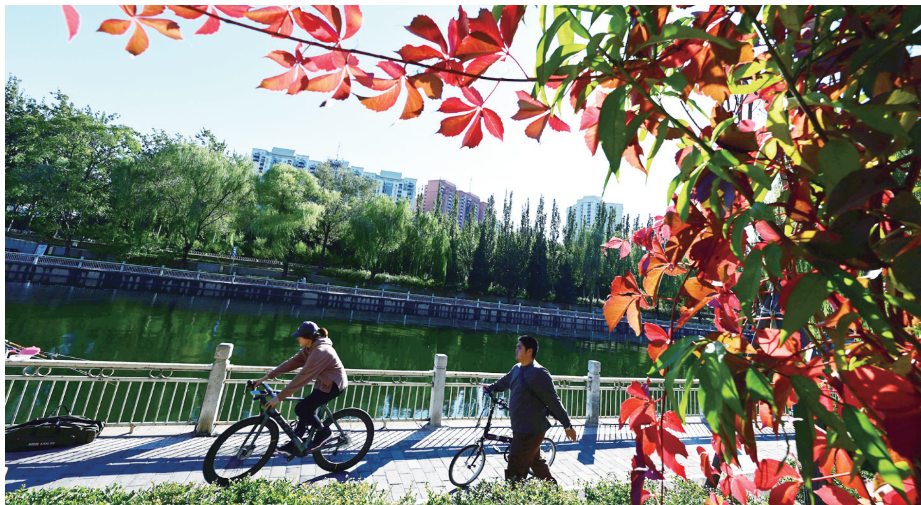
南护城河是市民休闲运动的好去处