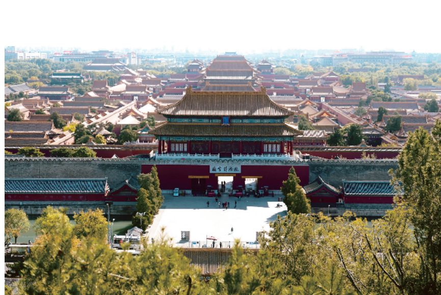
北京中轴线壮观如画