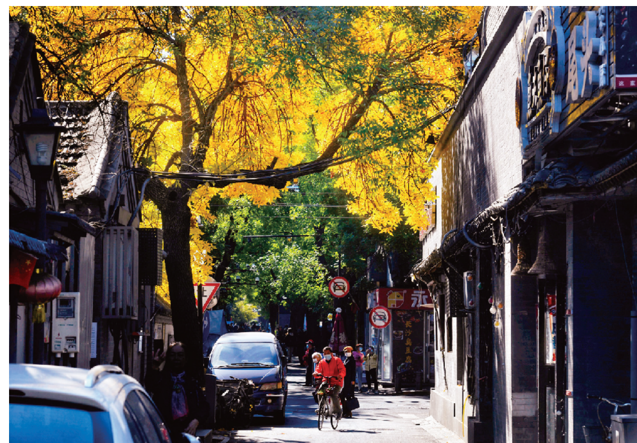
北锣鼓巷南口秋意正浓