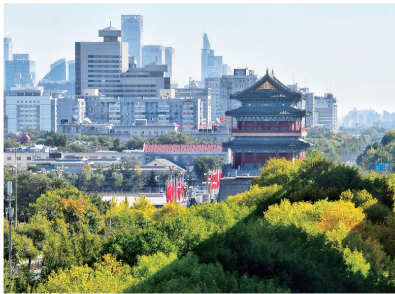
湛蓝的天空、黄绿相间的树叶……秋天的古都美不胜收