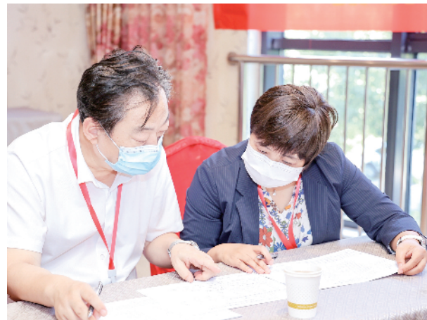
裁判聚精会神地为每一位选手进行评分