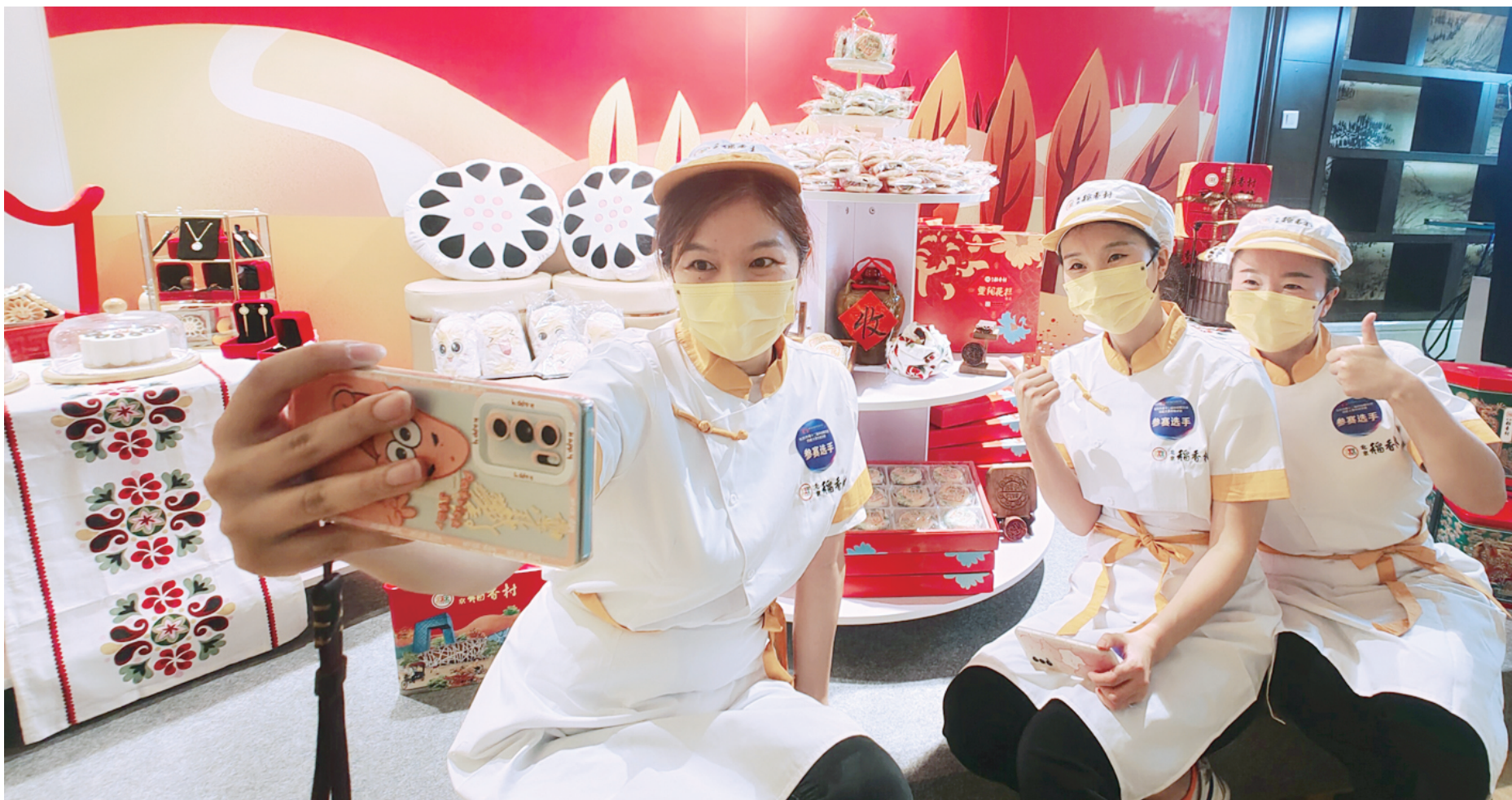
来自北京稻香村的选手在参加完项目比赛后，选手们和自己的作品合影