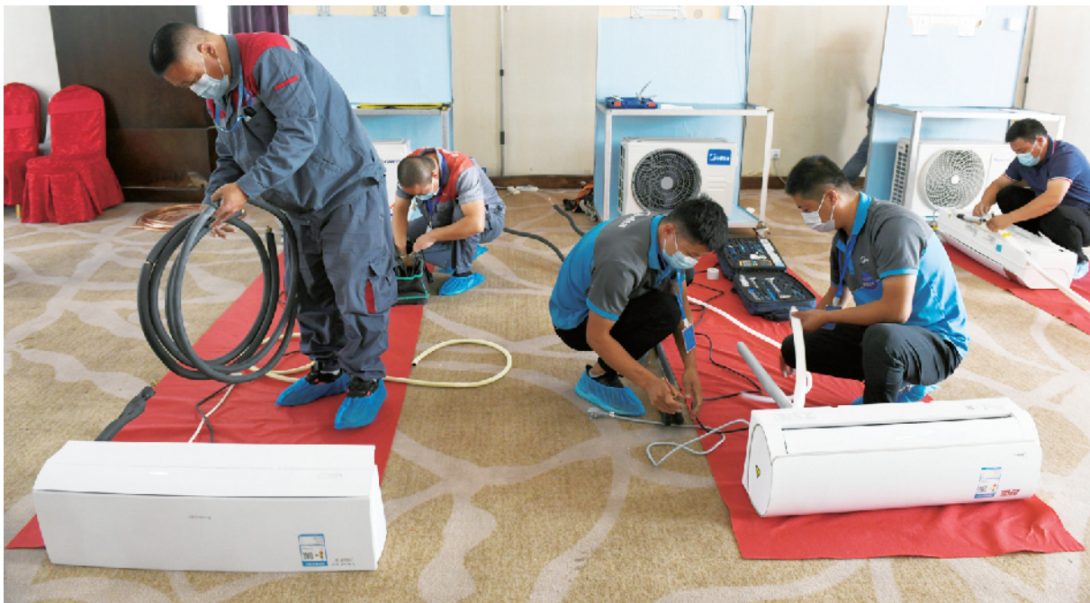
制冷空调系统安装维修工项目的选手不仅要熟练空调安装维修实操，还要有扎实的理论知识