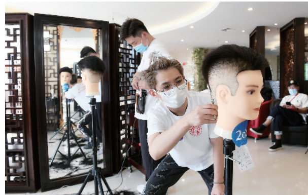
参加决赛的10名美发师紧张挥舞着剪刀，评委将会从设计、修剪、手法等方面进行全方位考量

据了解，北京市商业服务业技能大赛已连续举办十二届，已成为北京市商业服务业提升技能、培养人才的重要途径。本届技能大赛市级决赛，坚持以“技能提高商业服务业服务质量”为主线，积极为商业服务业职工搭建展示技能的平台，利用科技手段提升办赛水平，为提升首都商业服务业职工技能水平贡献力量。