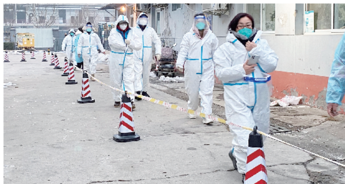
清晨，教师们化身“大白”前往社区核酸检测点参加志愿活动