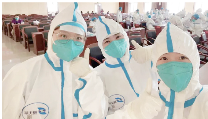
教师们坚守在封控考场

她经验丰富、方法灵活，总会主动把小组内其他流调志愿者手里的“困难户”抓在自己手里；总