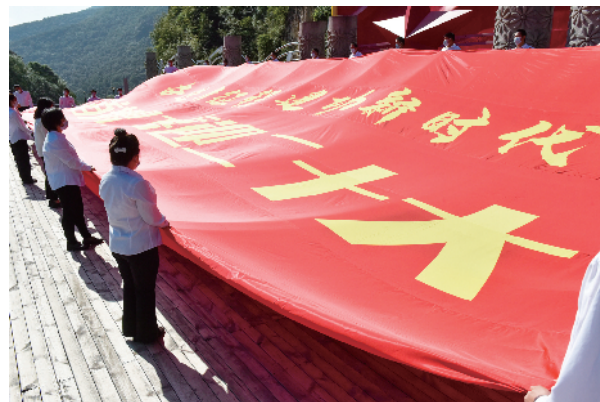
职工们徐徐展开长20米宽10米的巨型横幅