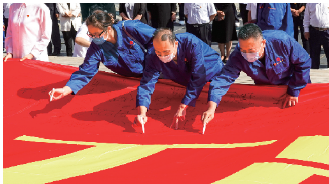
房山工业(集团)公司职工书写对党的崇高敬意