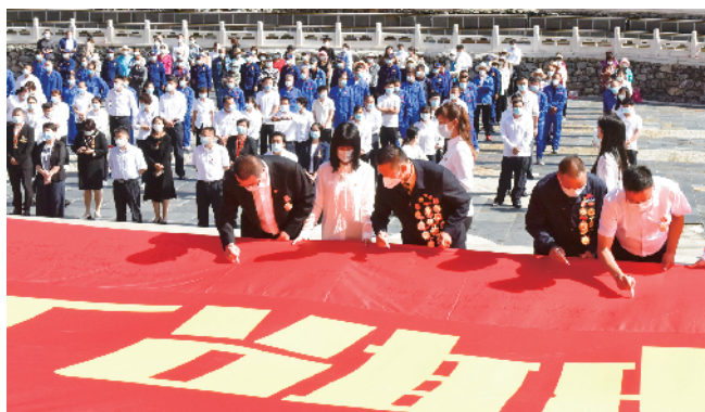
劳模代表在横幅上写下深情寄语