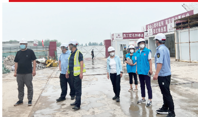
李遂镇总工会深入建筑工地开展安全生产大检查