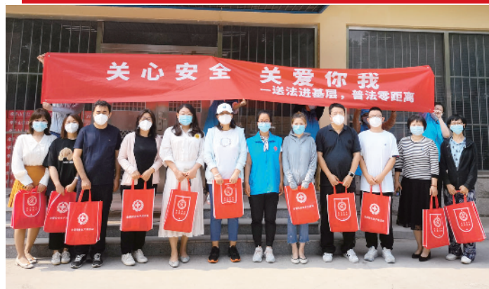
顺义区总工会开展“关心安全 关爱你我——送法进基层,普法零距离”活动