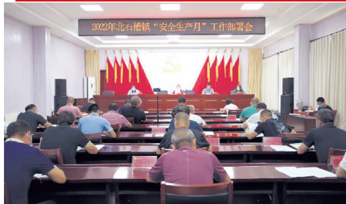
北石槽镇召开安全生产月工作部署会