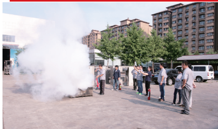
北京汉飞航空科技有限公司开展消防演练活动