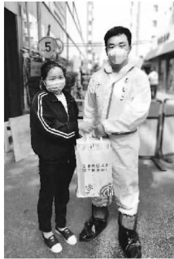
网上学习的平板电脑，确实让我们感到心中不是一番滋味。给孩子

一则，实现孩子的“微心愿”，体现了对孩子的精准教育帮扶。在一些特殊的家庭，由于经济方面的原因，一些孩子还没有进行