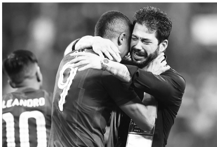
柔佛新山锁定小组第一晋级淘汰赛

更需引起注意的是，由于受到客观因素影响，中超球队长期与亚洲赛事隔绝，尤其是今年亚冠中超球队派预备队出战导致成绩极差，让中超的积分排名大幅度下降，甚至被越南联赛超越。恐怕再过一两个赛季，中超很可能只有冠军队才有资格打亚冠，彻底沦为亚洲二流联赛。同时，中国一线球员失去了和亚洲强队较量的机会，这对他们的进步提高也是很大的打击，毕竟足球日新月异，你一年不打国际比赛，就会被落下很多。