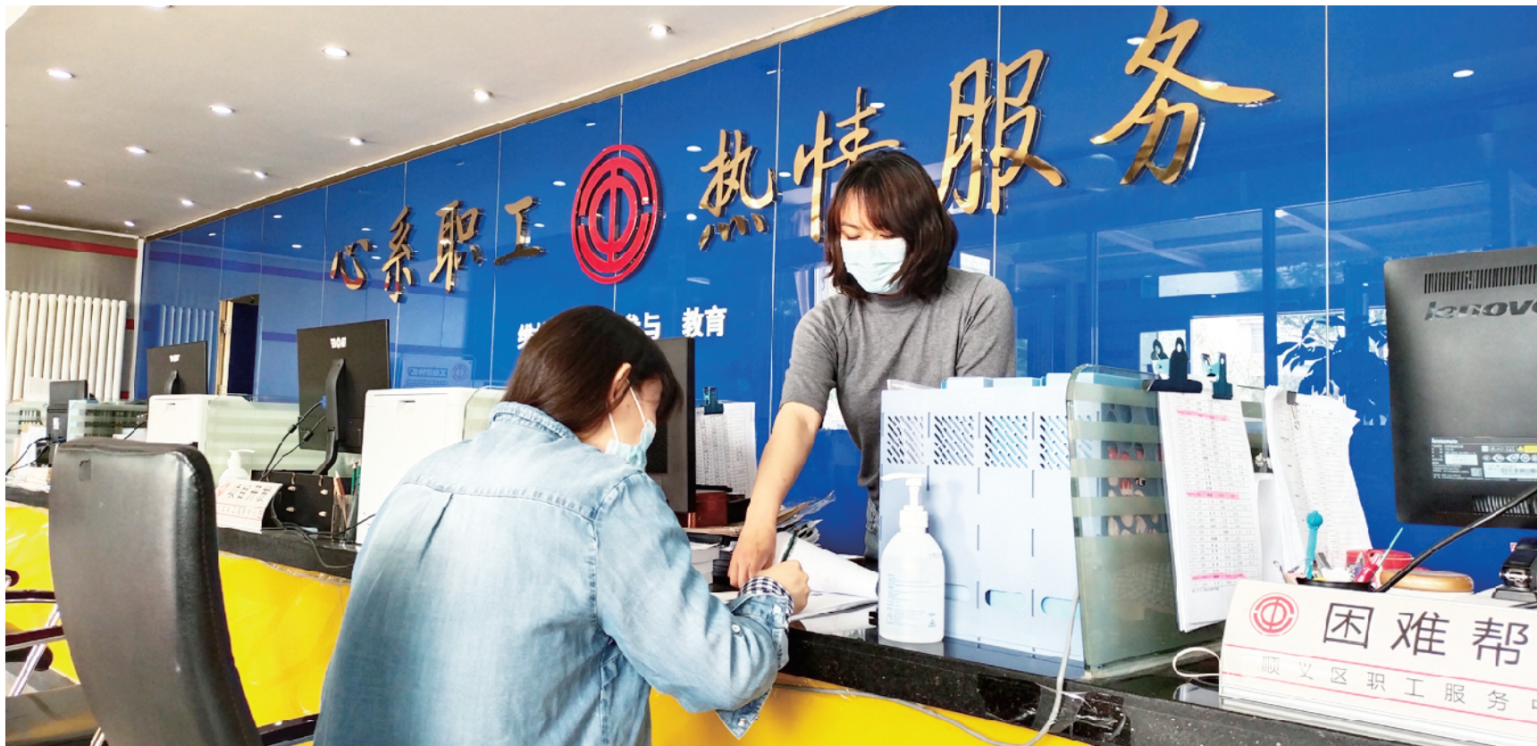
▲顺义专项温暖基金项目执行组对职工进行点对点的贴心服务