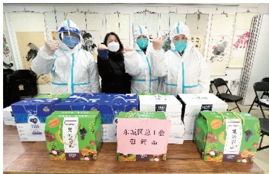
东城区总工会慰问疫情防控一线工作人员