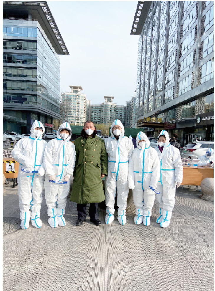
▲东城区总工会干部职工下沉社区疫情防控一线