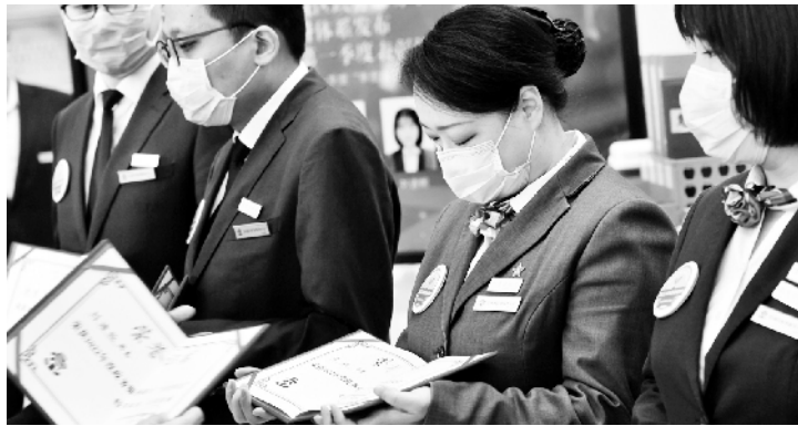
“季度模范”等荣誉称号，并颁发荣誉证书、佩戴荣誉徽章。

类似的帮办代办服务，对于区政务服务中心的工作人员来说已是常态，也是东城区提高政务服务效能、提升办事企业群众满意度的小小“一隅”。为“让想干事者有平台、会干事者上舞台、干成事者登奖台”，东城区自今年起正式启动区政务服务中心荣誉体系建设，并于近日举行荣誉体系发布会暨2022年第一季度表彰活动，为该中心2022年一季度获奖的综合窗口团队和个人授予“红旗团队”“每周之星”“月度标兵”