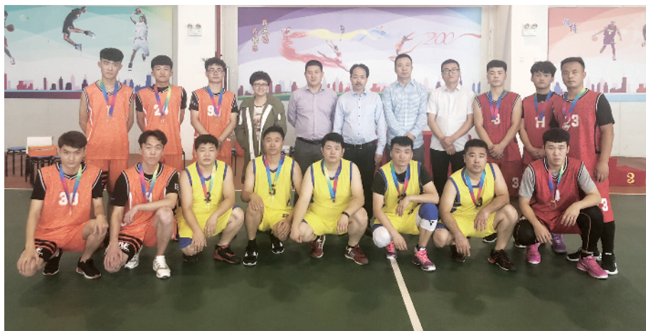
“京运通杯”职工篮球赛

2022年初，经开区总工会发布《北京经济技术开发区总工会“十四五”时期职工发展规划》（以下简称《规划》），根据《规划》，“十四五”时期，经开区总工会将把职工发展事业的重点指标、重点任务纳入政府相关经济社会发展专项计划，通过打造服务品牌，构建职工思想政治工作体系、职工教育培训体系、职工权益维护体系、职工服务保障体系以及新型组织管理体系等5个新型工会工作系统，支持和激励广大职工在新时代更好地建功立业。经开区总工会负责人表示，“未来，经开区总工会还将继续用好相关政策和扶持办法，分析挖掘企业服务诉求和潜在需求信息，因企施策制定‘一企一策’，赋能企业高质量发展。”