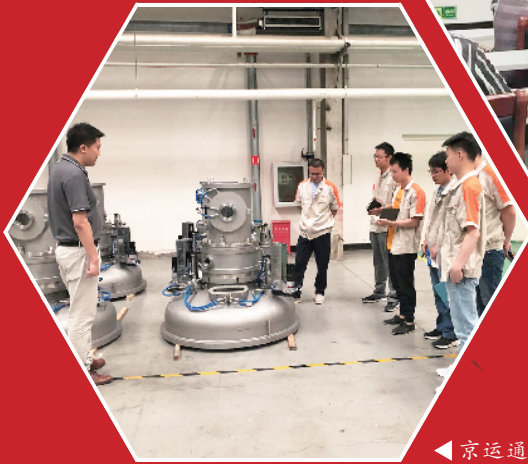
京运通进行安全生产培训