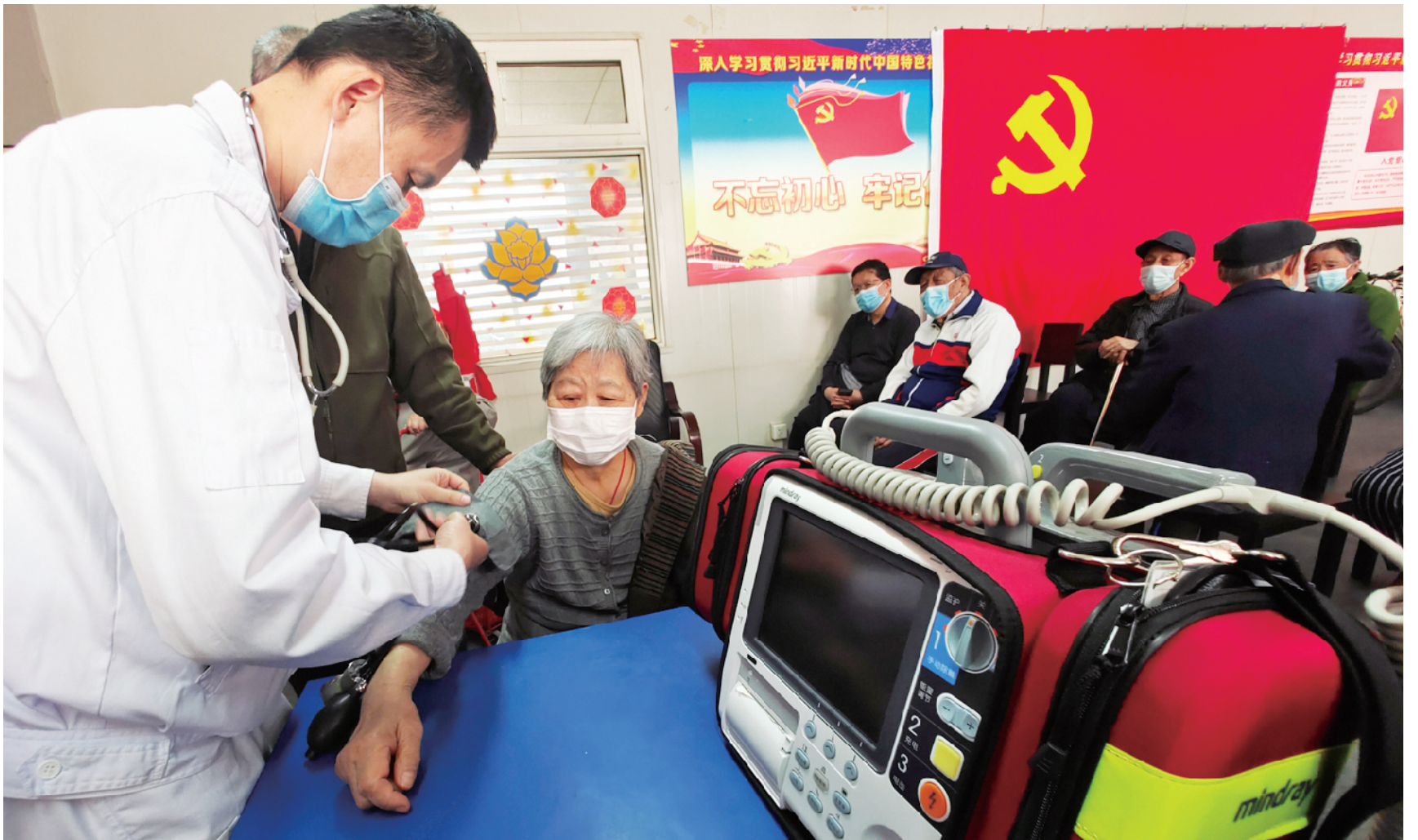
接种疫苗前,120急救医生为老人测量血压