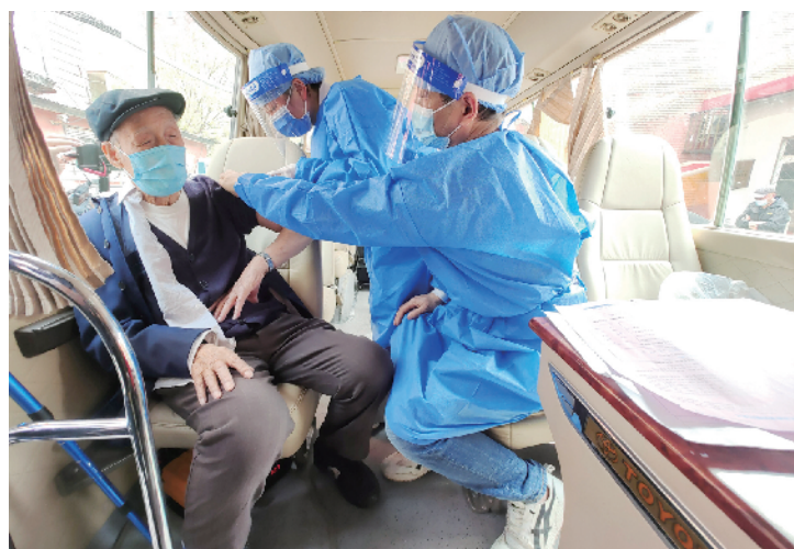
接种小分队将接种车开进社区,就近服务

中244.47万人完成加强免疫接种，接种的老年人中最年长者为一07岁。为了帮助更多老年人接种新冠疫苗，全市各区都在积极推进相关工作，科普宣传、答疑解惑、派出疫苗接种小分队、开出移动疫苗接种车、开设临时接种点……一系列便民暖心举措，帮助老年人群体筑牢免疫屏障。