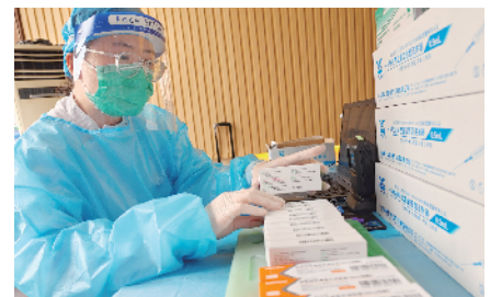
临时接种点的医生清点疫苗试剂数量