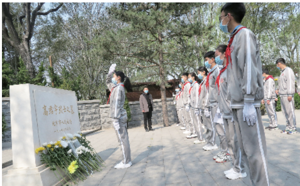
北京六十六中的学生清明祭奠高君宇烈士