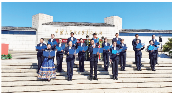
抗战纪念馆讲解员、志愿者朗诵抗战诗歌