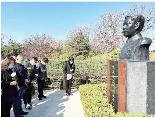
丰台区青塔街道岳各庄村组织党团员向崔大庆烈士敬献鲜花