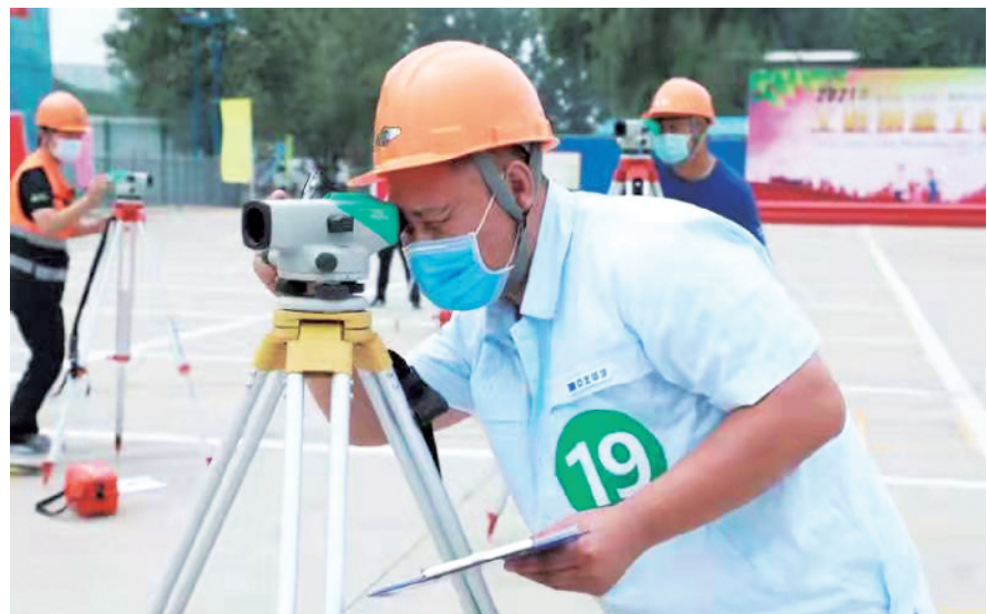
2021年顺义区建筑行业工程测量工技能竞赛现场