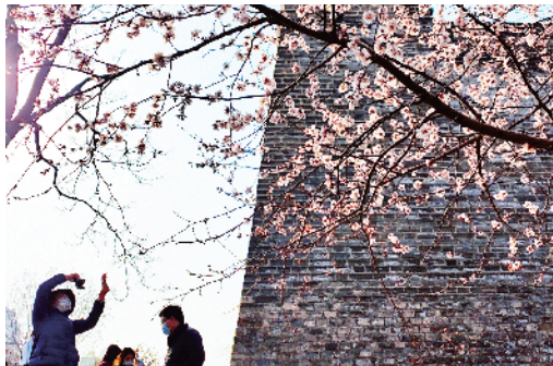
明城墙遗址公园，春花 in 城墙的映衬下娇艳欲滴