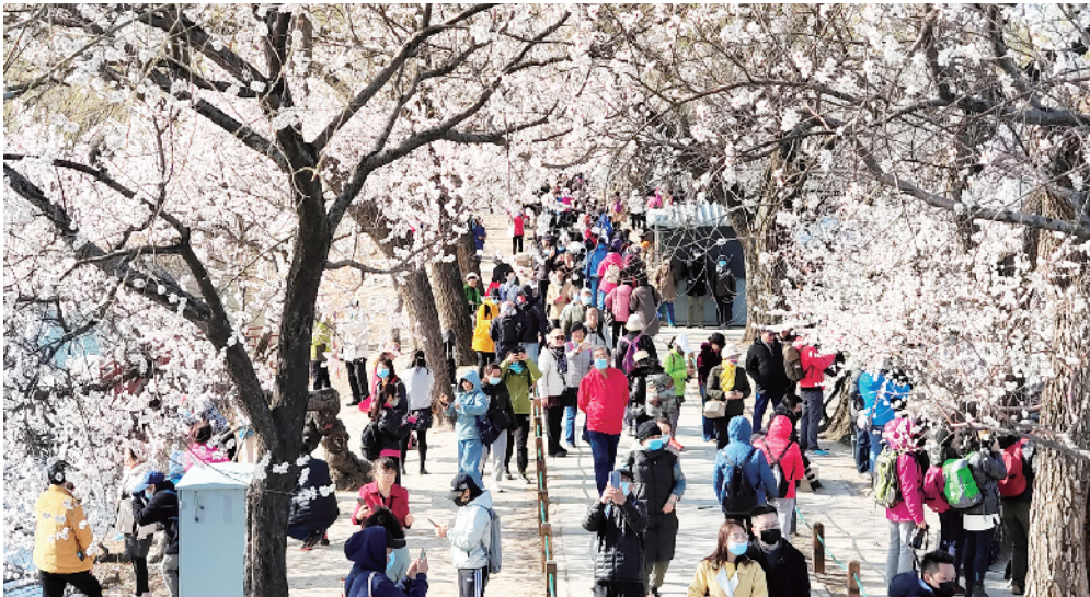
颐和园西堤绿柳吐新、春花正俏，吸引市民前来赏春“打卡”