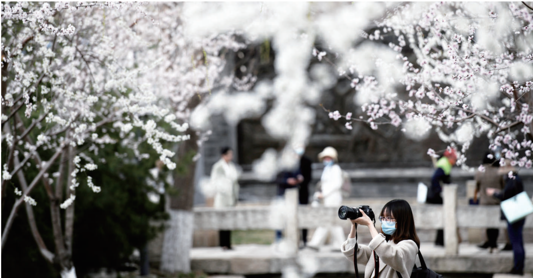
前门三里河公园春意盎然