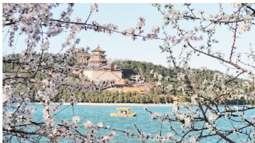
玉泉山玉峰塔在桃红柳绿的掩映下更加秀美