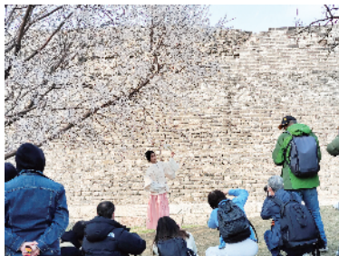
身穿汉服的姑娘，用倩影定格春天

熬过了漫长的寒冬，伴随着和煦的春风，迎来了生机勃勃的时节。繁花似锦三月天，人们陶醉在春光里，所到之处，无不蕴含着朝气蓬勃的生机。