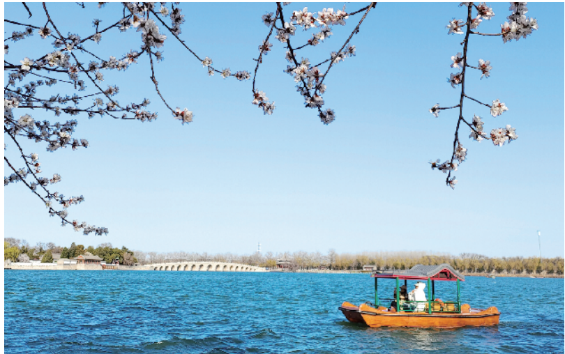
春日里，泛舟昆明湖赏花看景，仿佛“游在画中”