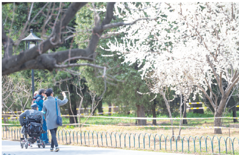
很多市民利用周末带着家人户外踏青