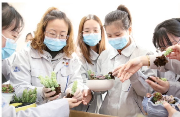
北京建工建材新科公司工会举办“巾帼展风采 一起向未来”活动,开展女性健康知识讲座、DIY绿植等