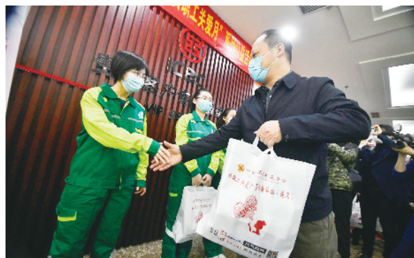
北京市服务工会与中国职工发展基金会联合开展“女职工关爱月”系列公益活动,向快递、园林绿化、环卫等行业一线女职工代表赠送“三八”节礼物