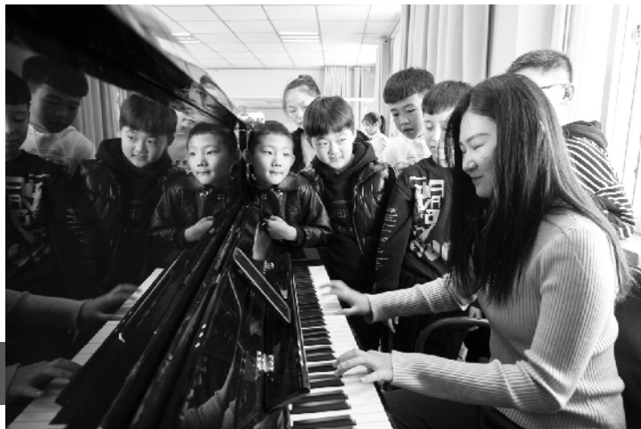
排练间隙,孩子们聆听“老师妈妈”的演奏