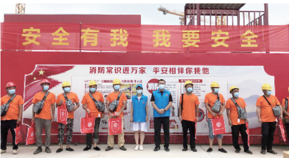
深入生产一线、施工工地等场所开展宣传活动