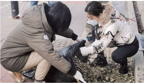
顺义区总工会机关党员干部参与重点地区疫情防控检查和社区志愿服务活动