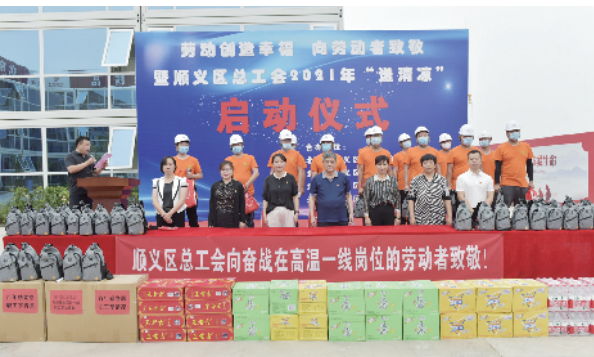
2021年度“送清凉”活动启动仪式现场