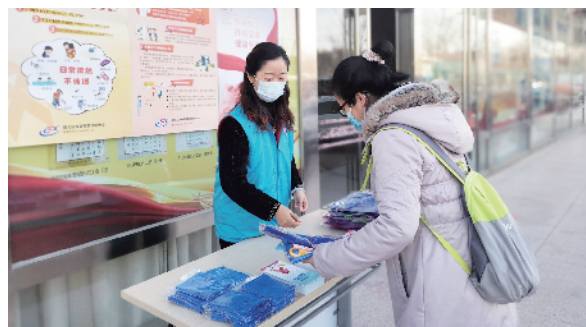
积极开展各项普法活动

顺义区总工会采取“互联网+”方式,为全区2700余名劳动保护监督检查员建立线上培训平台;全区工会系统累计组织了万名职工参加全国“安康杯”职工安全应急技能知识竞赛答题活动,并深入生产一线、施工工地等场所开展职业病防治法宣传活动,发放万余份宣传资料;此外,顺义区总工会稳步推进争做“职业健康达人”和第二届职业健康传播作品征集活动,征集上报“职业健康达人”11人,职业健康传播作品6份;举办工会劳动保护干部培训班、应急救援救护技能培训班,3000余人受益。在积极构建和谐稳定劳动关系方面,顺义区总工会通过法律热线、法律服务窗口为463名职工解答法律问题,提供383起公益法律援助,涉及工资、保险补偿金等共计4904.03万元,目前已结案191起,结案数量居全市第三。12351职工服务热线共接到各类诉求430件,全部妥善处理。通过落实“吹哨报到”工作机制,顺义区总工会配合处理了松下环境公司、第三代半导体公司等多起群体劳动争议案件,成功调解175起劳动争议案件,涉及职工529人,涉及资金3048.07万元。2021年,顺义