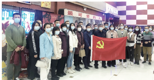
开展“观影学党史”活动

区总工会建立了工会系统技能人才库,其中包含了高技能人才、工匠、创新工作室领军人物等5类优秀职工群体326人;在促进新就业形态劳动者群体素质学历提升方面,顺义区总工会联合区社教中心录制安全生产隐患排查治理等视频课程,制定《顺义区总工会2022年会员职工学历提升工作三年助推方案(草案)》,将开设物流管理专业学历提升班。