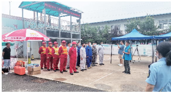
顺义区2021“工匠杯”有限空间大比武决赛现场