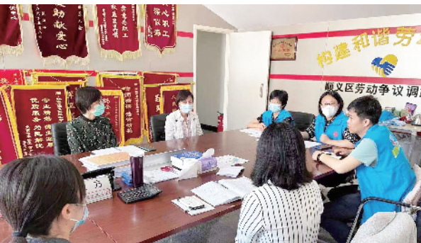
2021年,顺义区劳动争议调解中心被评为“十大金牌调解组织”