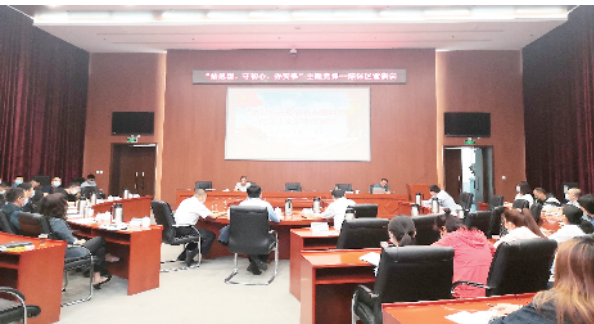
深入开展“悟思想、守初心、办实事”主题党课