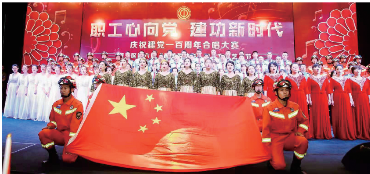
线上线下相结合开展“最美劳动者·奋进新征程”第六届职工文化艺术节

在过去的一年,顺义区总工会围绕中心,服务大局,着力在促进职工技能提升、创新发展,以及助力区域发展等方面积极作为。在鼓励职工创新提升方面,顺义区总工会全面落实经济技术创新三年助推方案,投入资金101.08万元助推职工经济技术创新和技能提升。“我们先后举办了建筑行业工程试验工、工程测量工、有限空间作业大比武3场区级技能竞赛,19名职工在各级技能竞赛中获奖,170名职工取得等级证书,评选出顺义区社区教育中心‘慧企讲堂’、北京奥格尼克生物技术有限公司等8个区级创新工作室,河道治理及水体生态修复治理系统等25项区级创新成果。”据顺义区总工会相关负责人介绍,在顺义区总工会与北京城市学院合作开展的计算机辅助设计师等5个职业(工种)线上技能培训中,289名职工获得技能提升。在积极搭建平台助力工匠人才脱颖而出方面,顺义