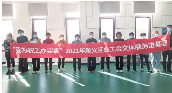
开展“送文化进基层”活动

顺义区总工会采取“互联网+”方式,为全区2700余名劳动保护监督检查员建立线上培训平台;全区工会系统累计组织了万名职工参加全国“安康杯”职工安全应急技能知识竞赛答题活动,并深入生产一线、施工工地等场所开展职业病防治法宣传活动,发放万余份宣传资料;此外,顺义区总工会稳步推进争做“职业健康达人”和第二届职业健康传播作品征集活动,征集上报“职业健康达人”11人,职业健康传播作品6份;举办工会劳动保护干部培训班、应急救援救护技能培训班,3000余人受益。在积极构建和谐稳定劳动关系方面,顺义区总工会通过法律热线、法律服务窗口为463名职工解答法律问题,提供383起公益法律援助,涉及工资、保险补偿金等共计4904.03万元,目前已结案191起,结案数量居全市第三。12351职工服务热线共接到各类诉求430件,全部妥善处理。通过落实“吹哨报到”工作机制,顺义区总工会配合处理了松下环境公司、第三代半导体公司等多起群体劳动争议案件,成功调解175起劳动争议案件,涉及职工529人,涉及资金3048.07万元。2021年,顺义