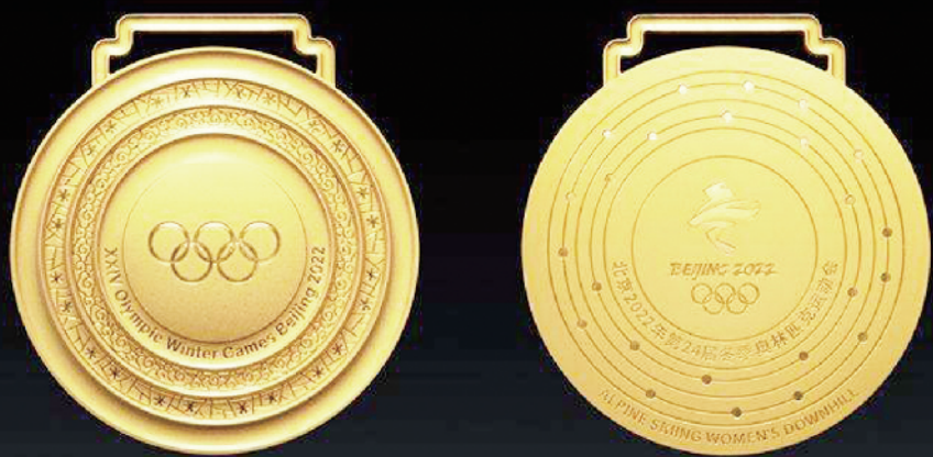
北京 2022 年冬奥会奖牌 正面