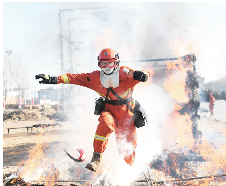
森林消防队员进行火场心理行为训练