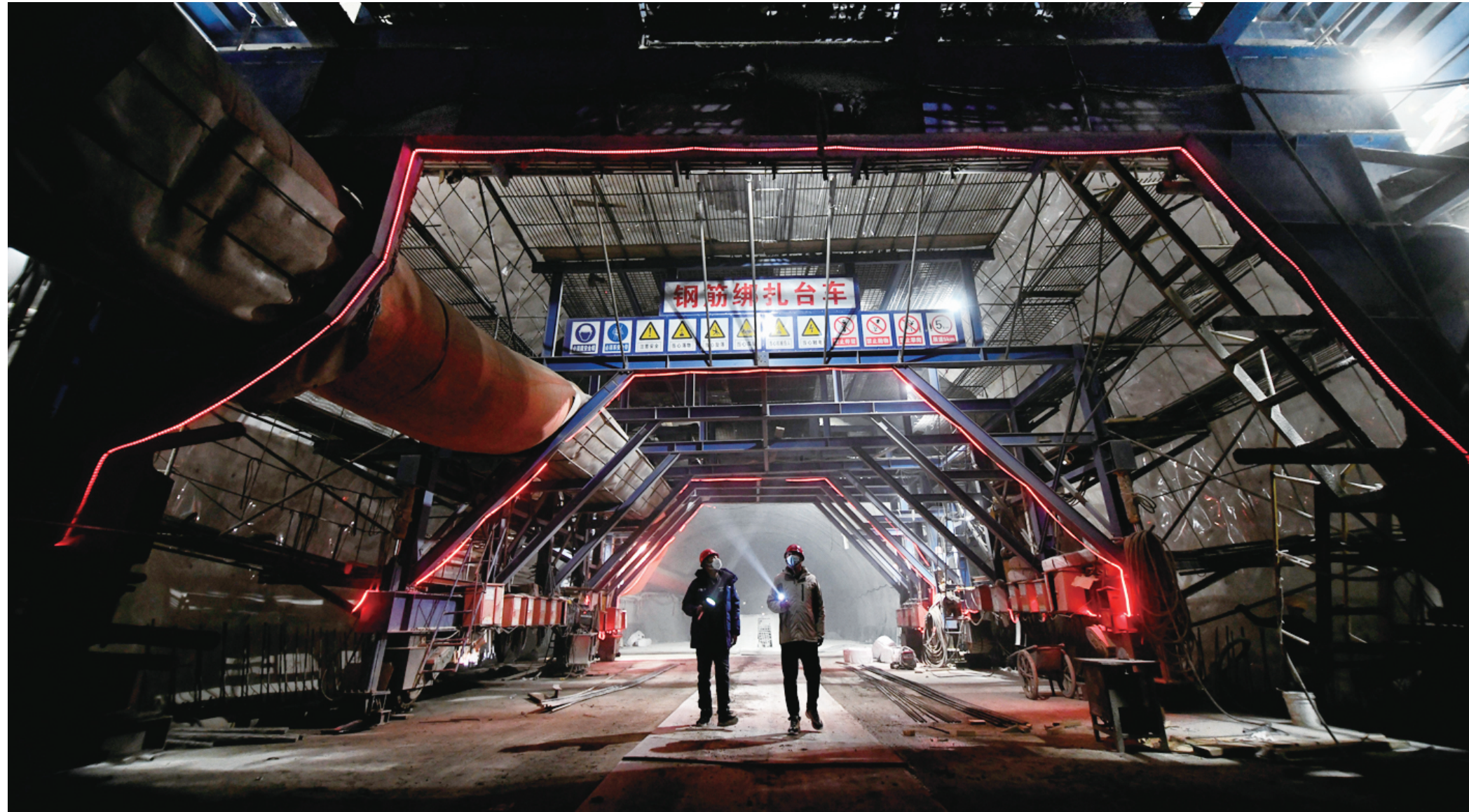
北京市政路桥总承包二部职工在加紧推进国道109新线高速公路项目施工进度