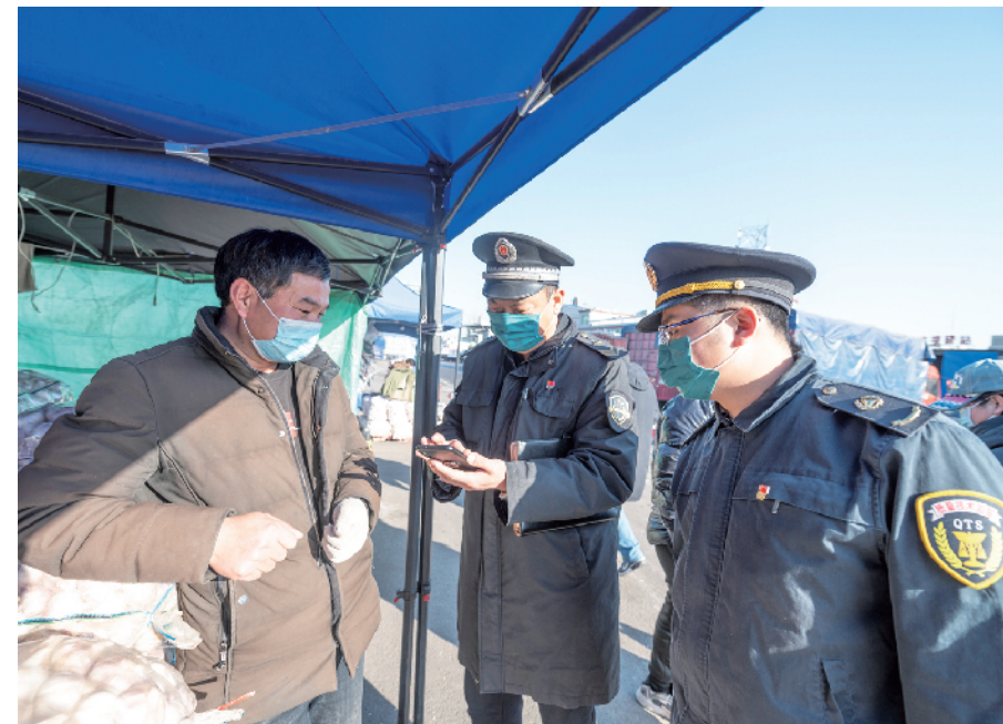
新发地市场监管所工作人员冒着寒风开展执法检查

近期,北京受寒潮影响气温大幅下降,元旦假期期间夜间最低气温低至-11~-8℃。为了保障市民正常生活,许多行业的劳动者仍然坚守在各自的工作岗位上,一如往常地辛勤工作。