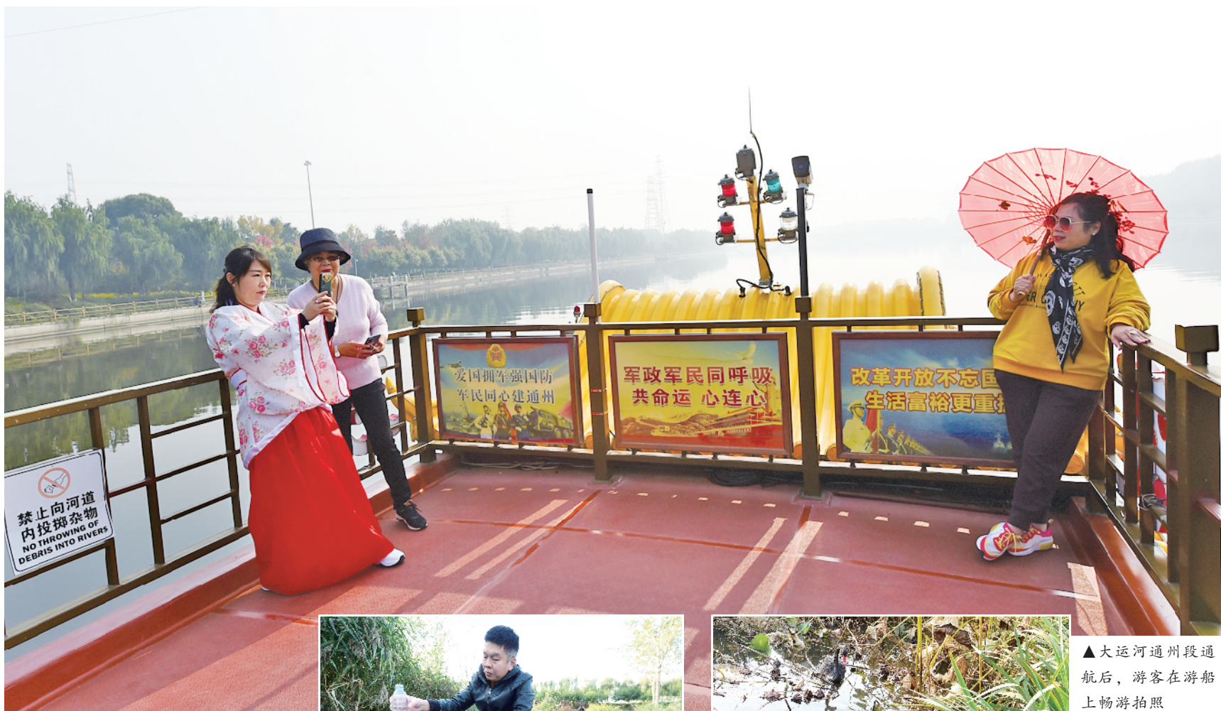
▲大运河通州段通航后，游客在游船畅游拍照