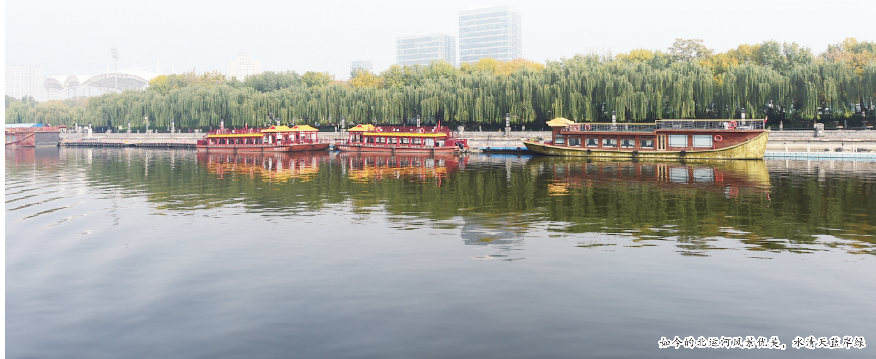
如今的北运河风景优美，水清天蓝岸绿