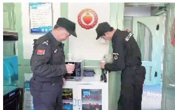
保安员在户外暖心驿站休息