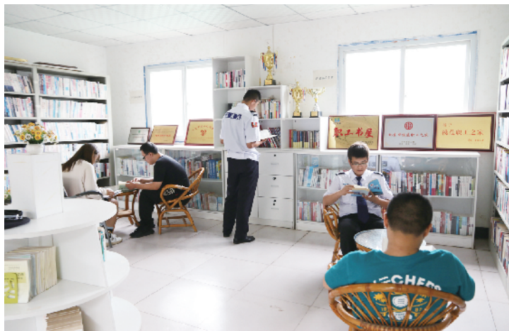
业余时间,保安员们在书屋内读书