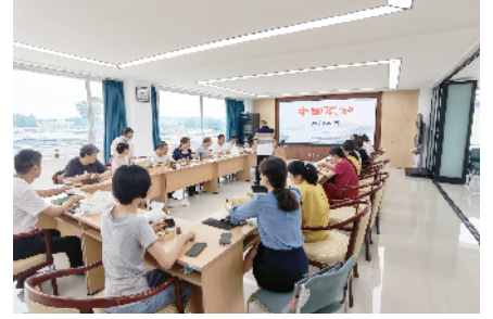
顺义区总工会开展文化服务进基层活动