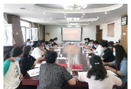
顺义区总工会召开新就业形态劳动者劳动保障权益维护试点工作推进会