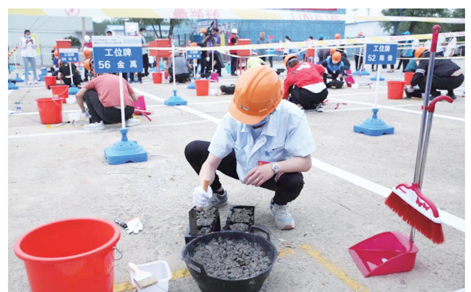
“工匠杯”建筑行业工程试验工职业技能竞赛