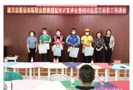
顺义区总工会开展新就业形态劳动者创城知识宣讲活动