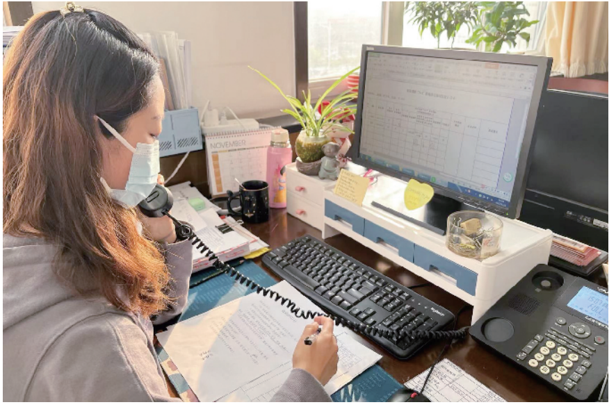
顺义区总工会干部电话访问居家观察“3+2”措施落实情况

益维护。顺义区总工会研究起草《顺义区总工会新就业形态劳动者劳动保障权益维护试点工作方案》，将北京顺丰速运有限公司和北京极兔供应链管理有限公司列为新就业形态劳动者劳动保障权益维护试点企业，组织召开推进会。成立由区总工会、区人社局、企业所属二级工会、市级集体协商指导员组成的领导小组，通过沟通宣传、分类指导、开展协商、总结经验四个阶段，督促指导企业建立完善集体协商制度，以此维护试点单位职工的合法权益。 “试点探索成熟后，相关工作也将在全区其他新就业形态企业或行业内推广，进一步维护更多新就业形态劳动者的合法权益。”区总工会相关负责人表示。 竞技擂台再加实 技能提升促就业 做强竞技擂台，提升劳动者技术技能，从而进一步促进劳动者就业，是顺义区总工会提升劳动者“劳动创造幸福”意识的重要手段之一。区总工会通过“竞赛+培训”的方式，培养“工匠型”技能人才，营造引导劳动者积极学习技能，努