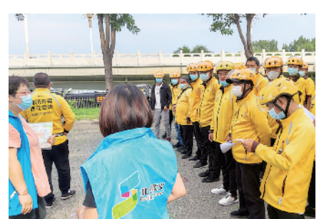
顺义区总工会开展新就业形态劳动者入会宣传工作