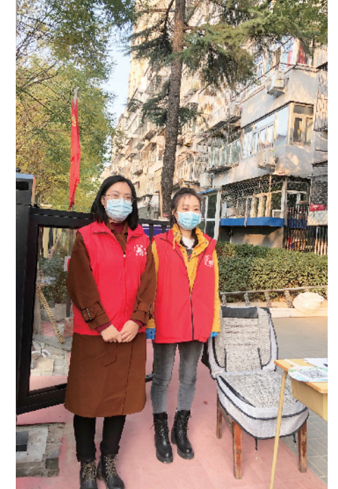
顺义区总工会干部下沉一线，参与社区疫情防控卡口值守