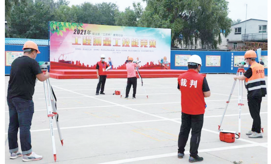
“工匠杯”建筑行业工程测量工职业技能竞赛