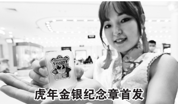
虎年金银纪念章首发

情绪,该区成立由安定医院心理专家组成的督导组,组建心理援助应急服务队,通过心理健康教育、“暖翼”心理自助平台、心理援助热线、线上线下干预等工作模式,为居家隔离人员提供心理援助服务,目前已“一对一”服务社区居民600余人次,帮助群众稳定情绪、增强信心,配合做好居家隔离工作。