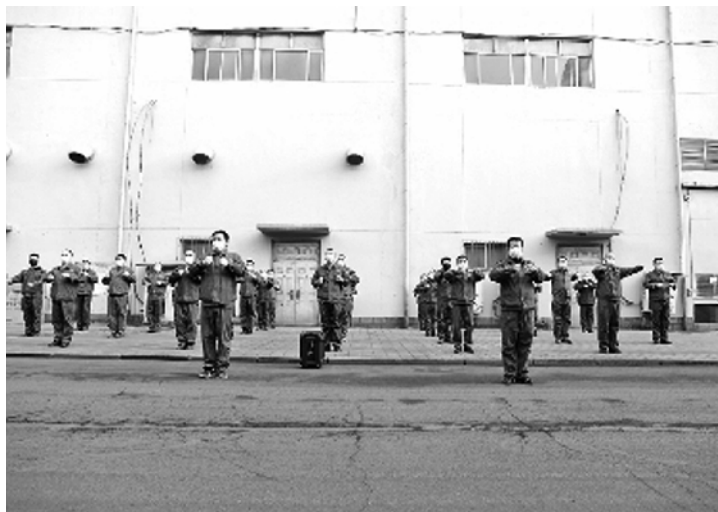
职工士气，营造团结协作、开拓进取的良好氛围，发挥了“磨刀不误砍柴工”的作用。这样的做法，值得推行！ □费伟华

许多职工每天在同一岗位上，不停地重复着同一工作，常常会感到精神头不足，产生疲倦感，影响到生产和安全。如何凝心聚力，激发出职工的精气神，笔者以为，河钢宣钢炼铁厂工会在职工中开展工间健身操活动，就是一个好做法。在工作的过程，适当安排一定的时间，让职工们动起来、跳起来，一可让他们充分感受到企业大家庭的温暖，增加对企业的认同感和归属感；二可增强体质，提振精神，让职工们拥有良好的工作状态，不断提升产能和效率；三可鼓舞