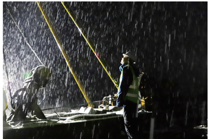
职工们在风雪中施工

坚守在雪域高原的这群人，离开了首都的热闹喧嚣，选择了川西的单调寂寞，用身体力行的实际行动，诠释着“最美劳动者”的含义、丰富着“最美劳动者”的内涵，在318国道旁勾勒出一幅“最美”的风景。