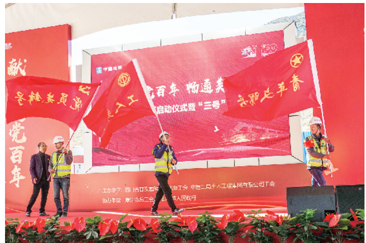
公司开展劳动竞赛