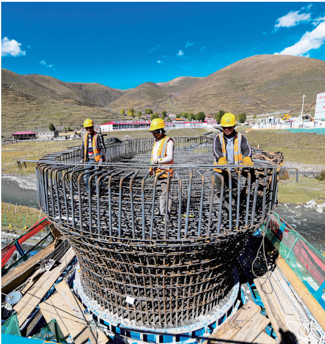
正在施工中的夹仲1号特大桥