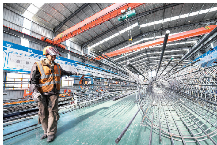
钢筋加工安全有序