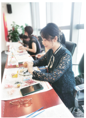
联合部分驻区企业开展“夏起清风——团扇制作”活动