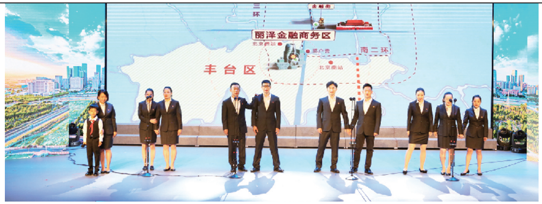
组织职工参加“五月的鲜花”歌咏比赛

丰台丽泽商务区管委会工会通过专题学习、参加“五月的鲜花”歌咏比赛等多种形式,充分发挥党组织、党员干部在工会工作中的引领作用与带头作用;联合辖区企业,先后开展整理收纳主题活动、团扇制作活动、“光盘行动”主题活动等,探索建立政企之间、入驻企业之间的交流沟通平台;设立暖心驿站、母婴关爱室,组织丰富多彩的文体活动,并积极参与新冠肺炎疫情防控工作、创建国家卫生区、创建国家森林城市等工作,用最贴心的服务、无微不至的关心关爱,为职工打造出“温馨港湾”。