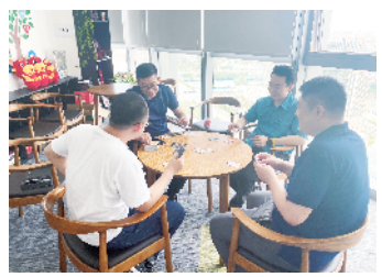
组织职工开展棋牌活动