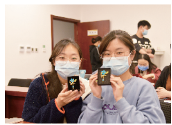
组织女职工开展“非遗传承点翠饰品”手工制作活动