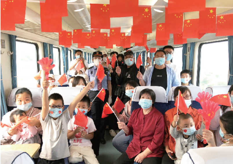
国庆节期间，从兰州开往天津西的G1714次列车上，全体乘务人员和旅客们挥舞着手中鲜艳的五星红旗，唱着激昂的国歌，抒发着对祖国的祝福