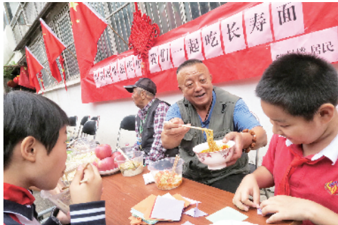
体育馆路街道天坛东里50号楼居民一起吃长寿面，为祖国母亲庆生