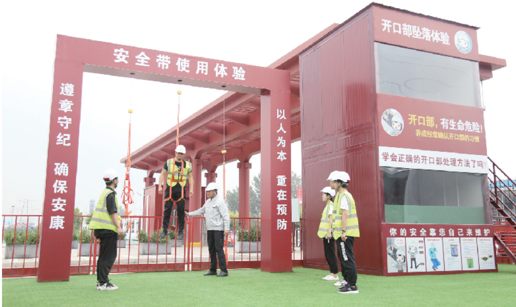
北京建工新材新科公司将安全教育趣味化，组织职工开展安全带吊挂等安全模拟体验活动