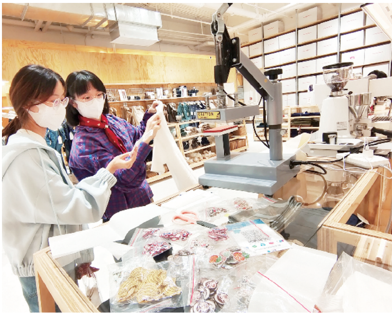
主打70、80年代复古情怀的“国棉壹厂”在小长假掀起了国潮风尚，备受年轻人的青睐

职工，开展多样趣味活动；北京建工新材新科公司将安全教育变成趣味活动项目，让职工在岗位上通过安全趣味体验活动，增强安全意识；体育馆路街道组织天坛东里50号楼居民一起吃长寿面，为祖国母亲庆生；延庆区大庄科乡组织村民“拔河”、“独轮车运粮”等庆丰收趣味活动。