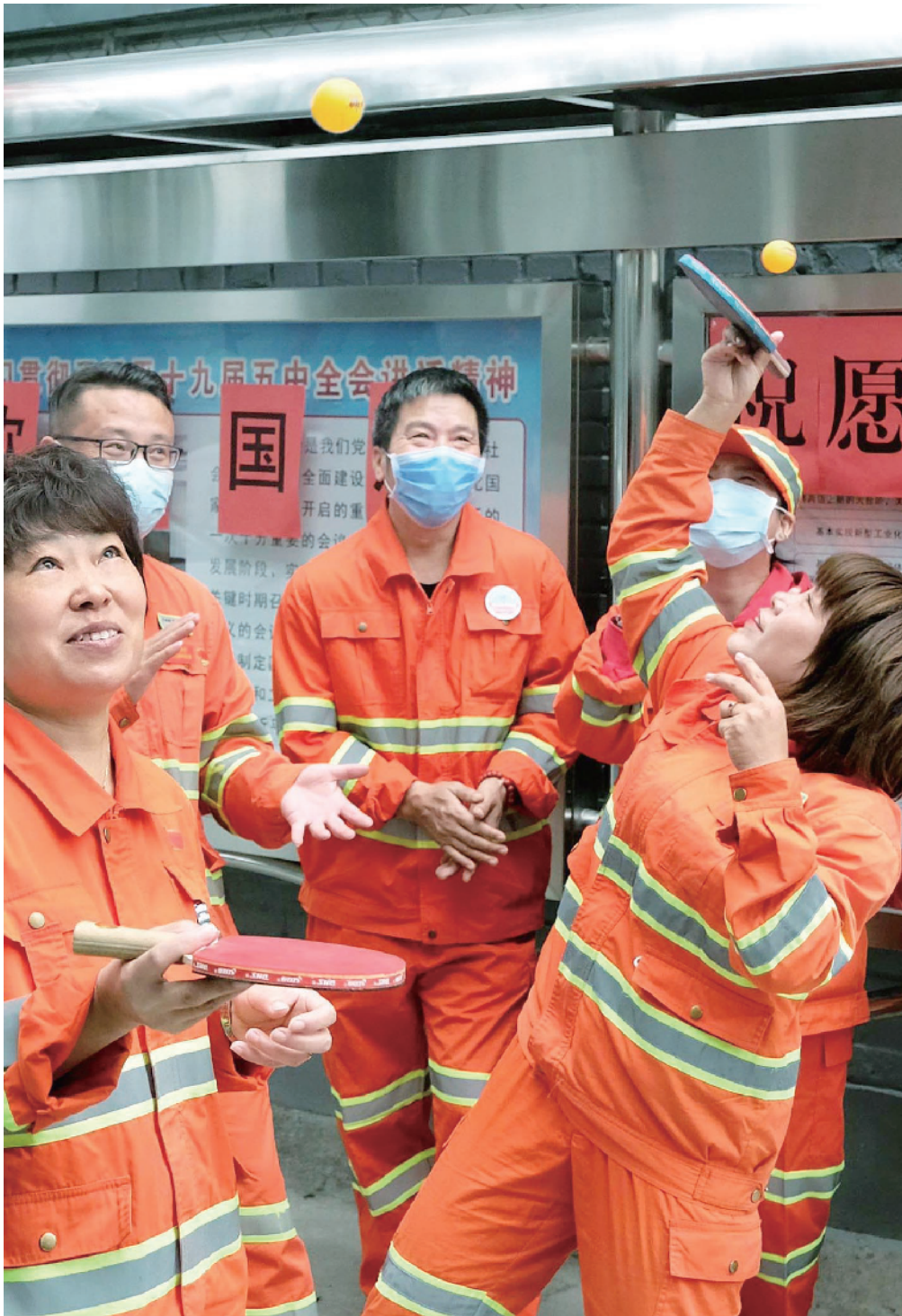
东城环卫中心一所的职工，开展多样趣味活动，欢度国庆