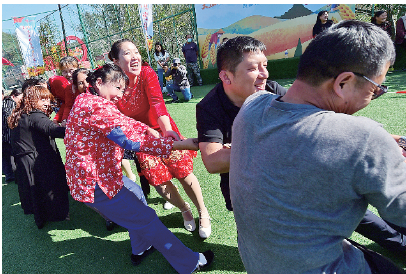
延庆区大庄科乡组织村民“拔河”、“独轮车运粮”等庆丰收趣味活动