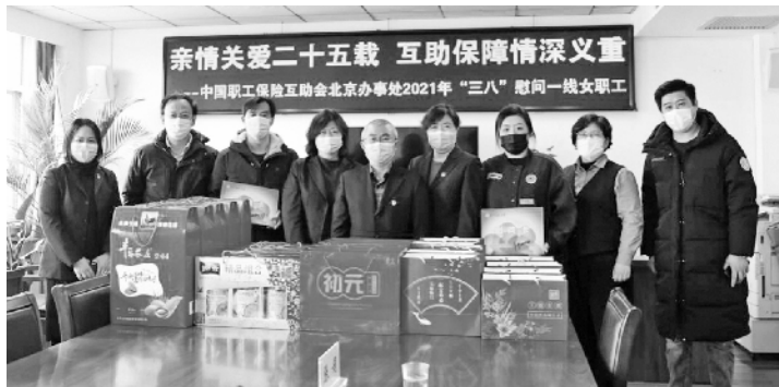
“三八”妇女节，中国职工保险互助会北京办事处慰问一线女职工

面向骨干经办人员，一方面定期举办专题培训班，除了讲授互助保障知识外，通过外聘教师丰富课程内容，拓展经办人员工作视野，提高工作能力。另外，定期组织参加全国范围内的业务研讨班，与全国各地的互助保障工作人员互相学习、交流，开阔