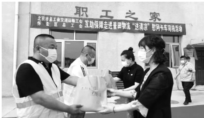
市交通运输工会、怀柔区总工会职工互助保障代办处联合开展“送清凉”活动