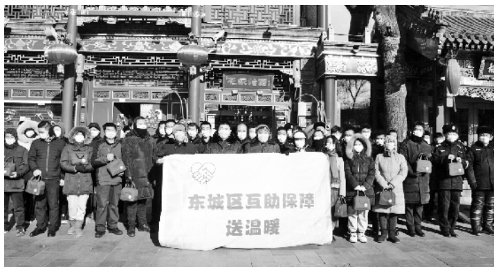
东城区总工会职工互助保障代办处“送温暖”活动