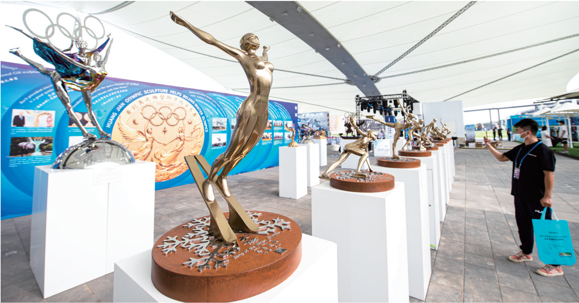
服贸会首钢园区14号展馆内，各类冬季运动塑像生动且充满艺术感，冬奥元素吸引了大众的目光