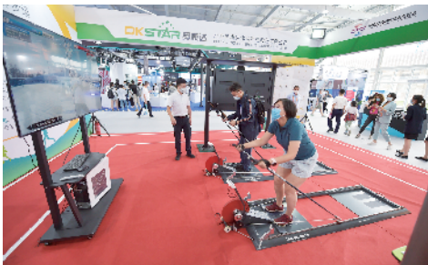
展商工作人员为体验者示范器械的使用方法

室内冰场上真冰玩耍起舞；穿戴可视设备跟着电脑屏幕“滑雪”；外面夏日炎炎，屋里飘洒着纷纷扬扬的雪花，有的参展商还把雪场上的缆车原样搬进展台……随着北京2022年冬奥会的脚步日益临近，冬奥气息愈加浓厚。2021年服贸会体育服务专题展同时在3个场馆举办，大量的冬季运动体验项目让这里成为服贸会最热“打卡地”之一。