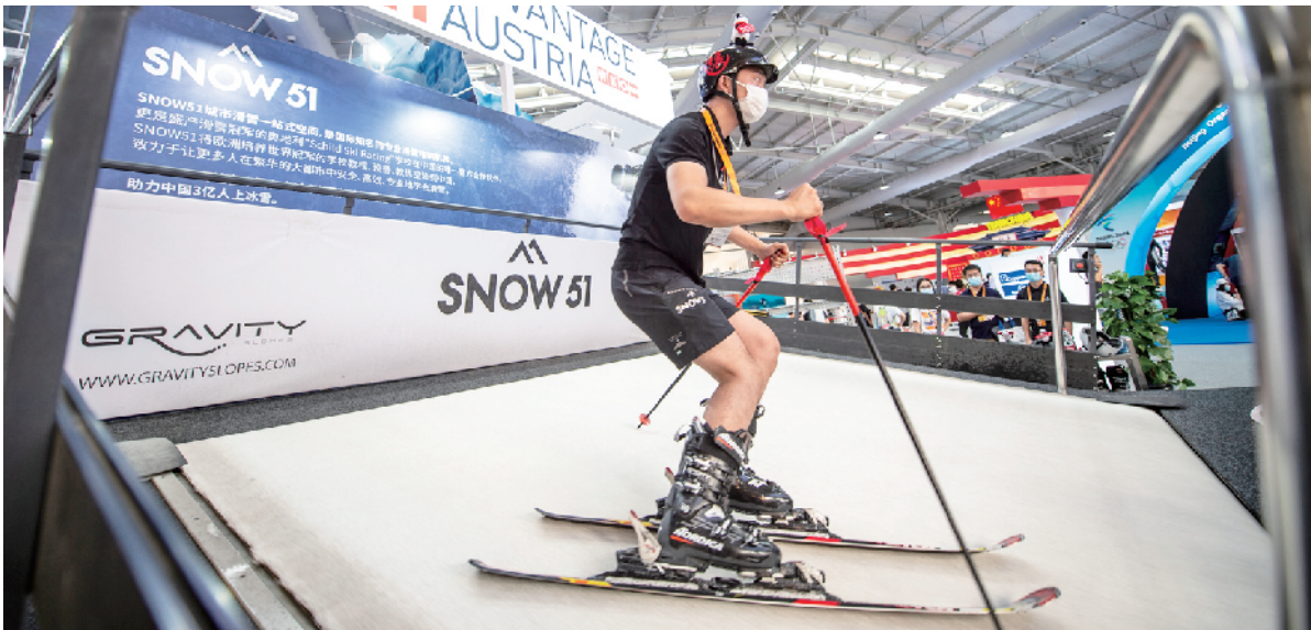
参展商展示一款滑雪模拟设备