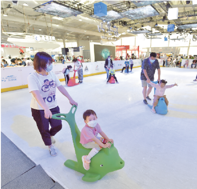
参观者上真冰滑动，体验者玩得不亦乐乎