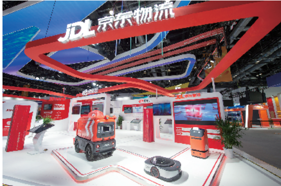
国家会议中心京东物流集中展示了室内配送、迎宾等智能服务型机器人、智能物流机器人产品