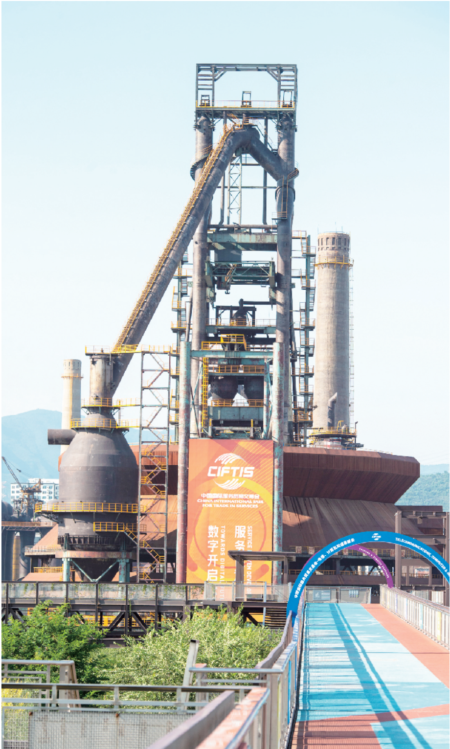
首次使用北京城市复兴新地标的首钢园区作为专题场馆，与工业风貌和奥运元素相结合，形成独具特色的服贸会场馆群