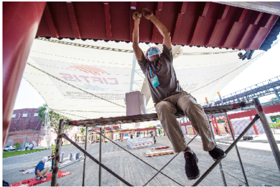
首钢园区场馆内，工人们紧锣密鼓的布展中