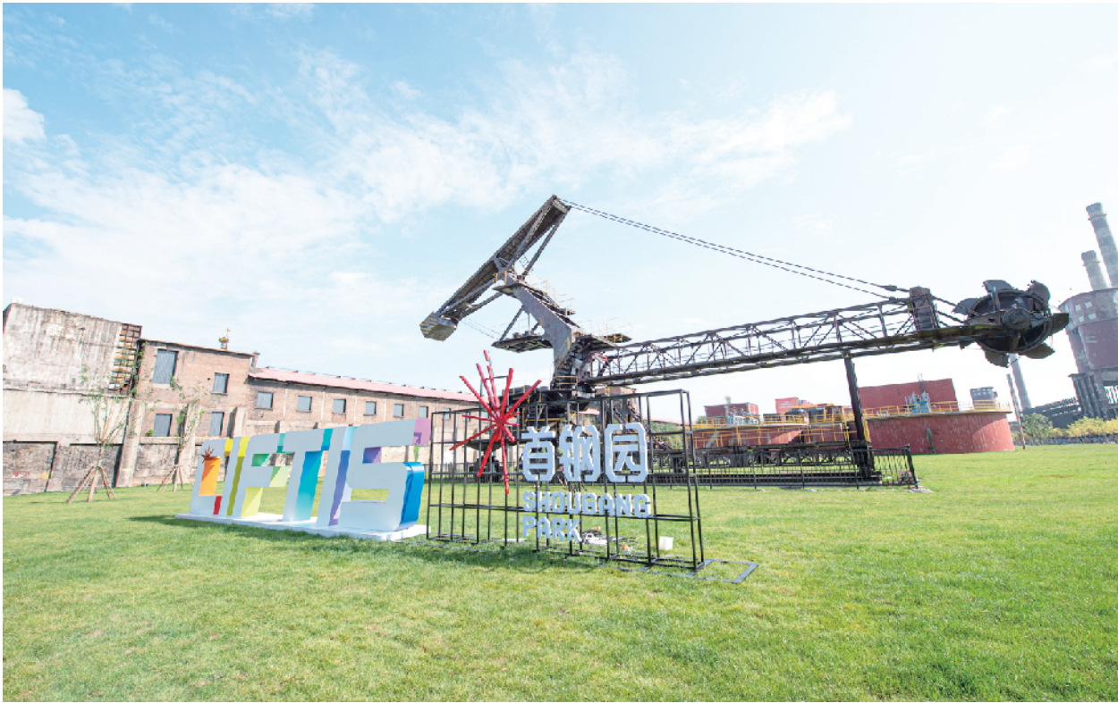
首钢园区内，服贸会标志与浓重的工业气息新意十足