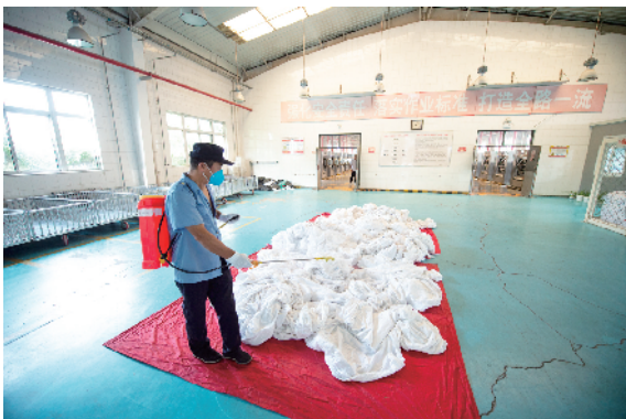
使用过的卧具送到洗涤车间摊开统一消毒