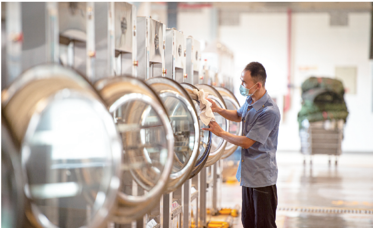
每一台洗衣机工作后都要再次消毒