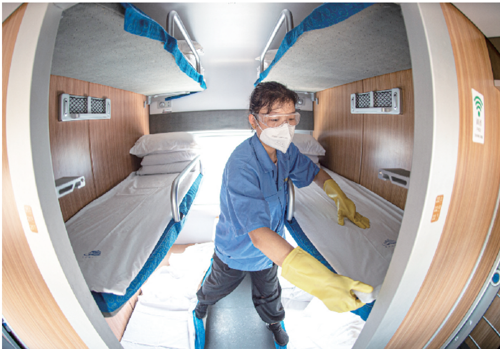
工作人员铺上干净的卧具迎接旅客