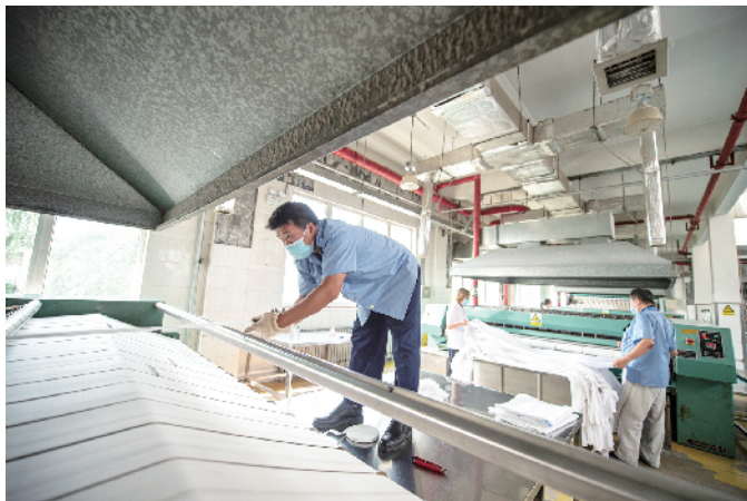
一名工人正在调试熨烫设备