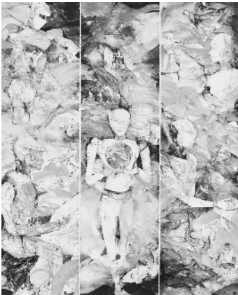
《飞驰的芯——人工智能组画》 赵怡文