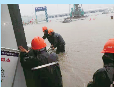
中铁北京局职工在河南灾区奋力抗洪

“感谢你们！”一位被困轿车的大姐顺利脱险时不断感谢着救援人员，“刚从车上下来，车就被冲走了。”这是中铁北京局职工参与河南灾区救援的