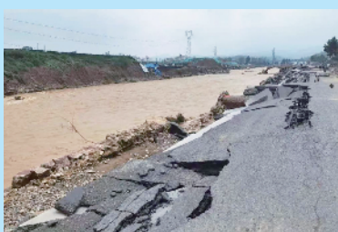
中建一局职工在疏通道路

“对面的养殖场门前雨水倒灌，积水瞬间有1米了！”中建一局二公司河南省怡养院项目接到消息马上组织了8名员工组成突击队，在党员带领下拿上防汛物资冲出了项目。养殖场内，3名留守人员面对倒灌的洪水在绝望中坚守，300余只鸡、20余头牛、20余头