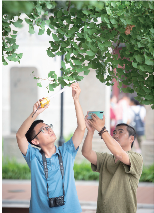
对古树的检测精确到每片树叶