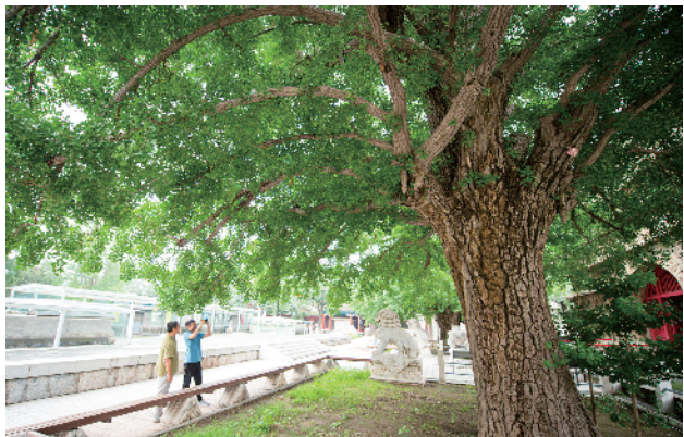
近六百年的古树，直径达两米多，十分震撼