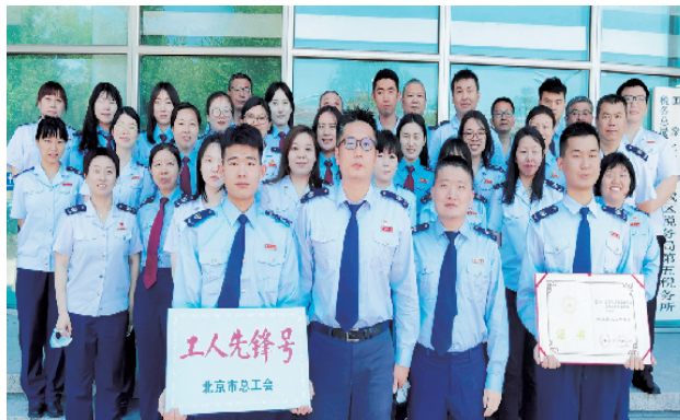
东城区税务局第五税务所

除此之外，业务部姑娘们还积极参与到阳光北亚家政学雷锋志愿服务队中，参与了为老服务、社区环境整治、周末大扫除等多项志愿活动。截至目前，业务部的姑娘们相继走进和平里街道、东四街道、龙潭街道、东华门街道等50余社区开展志愿服务，累计受益人次8.2万人次。