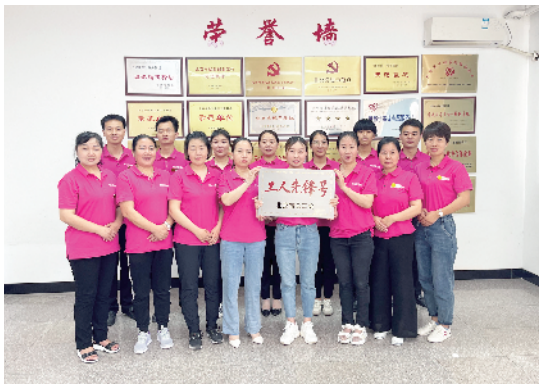
北京阳光北亚家政服务有限公司业务部